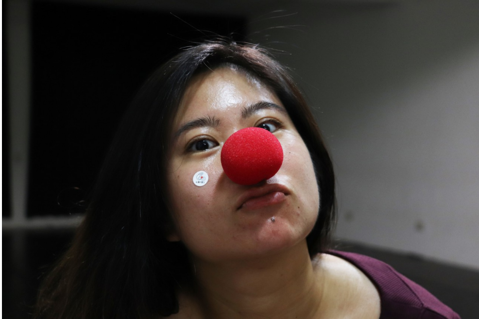
小丑醫生常運用貼紙作為和小朋友互動的工具。