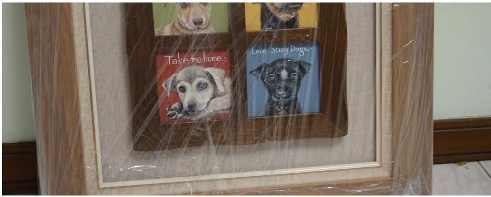
張育榕早期所畫關於流浪狗的插畫。

張育榕發現這是幫助流浪狗的一個方法，而且這是一個難得讓流浪狗曝光的機會，所以就開始舉辦「你領養，我送畫」的活動，只要有人願意領養，張育榕就會把關於那隻流浪狗的畫送給領養人。此外她專門為流浪狗開了一個粉絲專頁，平時會把作品和幫助流浪狗的相關活動發布到粉專上。然而舉辦此活動初期，張育榕承受了不少壓力：「因為那時候要和時間賽跑，我要趕在牠們被送去安樂死前把畫完成，而且發到專頁上。但有些時候我剛畫好就已經收到那隻狗被安樂死的消息，所以現在留在我身邊的畫，畫中的狗狗都已經在天上了。」張育榕覺得會出現這種情況是因為自己沒有到收容所最前線去服務，不了解流浪狗的狀況，所以她報名了新竹市第一屆的志工培訓，決心成為一名為流浪狗服務的志工。