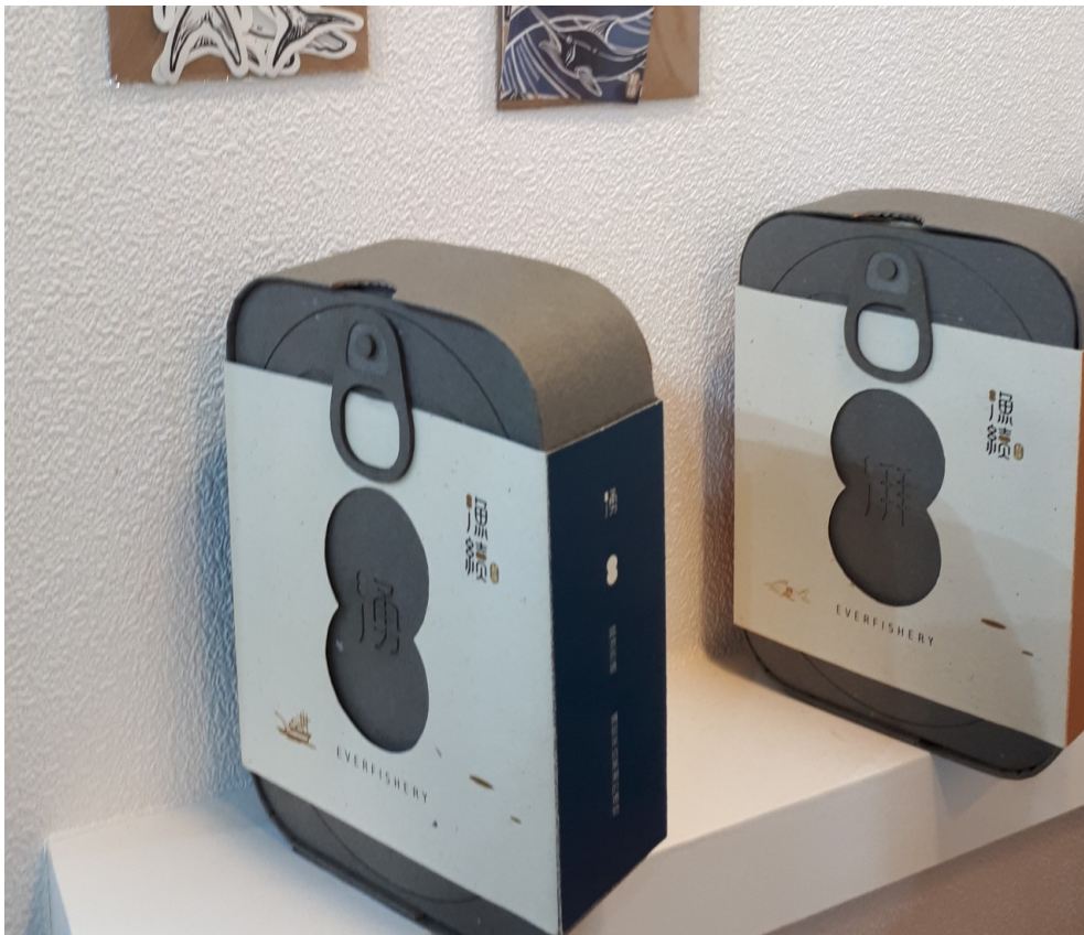
將地方特色產物結合文創，為商品增添附加價值。圖為學生為台東新港漁港打造的文創周邊商品。