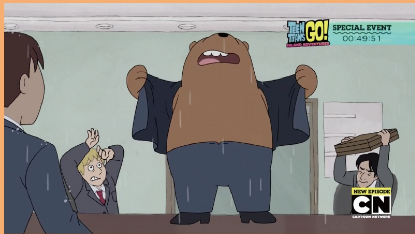
在〈Fashion Bears〉一集，三兄弟不願活在人類的框架下。

不過牠們卻也恰巧處在微妙、模糊的身份認同地帶，牠們不願意成為人類，但是卻又無法做隻正常的熊，在〈Bear Cleanse〉一集中，牠們因為健康檢查結果，被要求不能吃人類的食物，要吃熊應該要吃的東西，但是最後卻失敗了，正如同少數族群受到主流環境長期的影響，無法一時擺脫固有的文化所產生的結果。