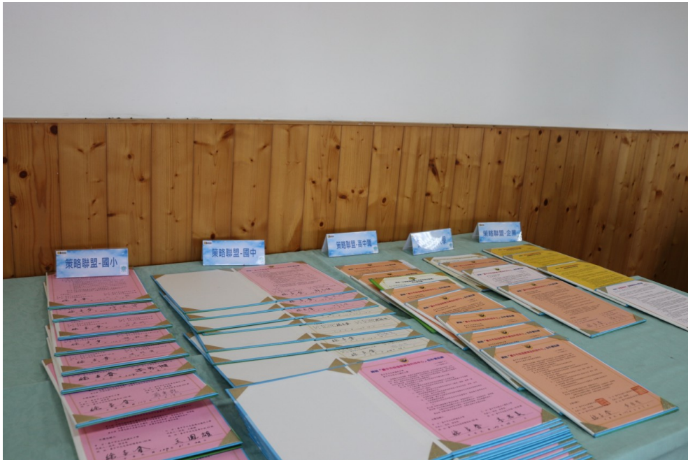
北新國中跟多所學校簽訂了策略聯盟，以分享科技教育相關經驗。

另外，徐吉春也預測，未來科技將會變成一種「工具」，他自民國104年起大規模推動全校性的「機器人教育」，集結了各科目的老師，將科技及機器人應用至不同的領域，教導每個學生寫電腦程式及製作不同功能的機器人，以讓學生盡早接觸、熟習科技，而現在不只每位學生都擁有自己的機器人，他們也將所學融入自己的創意，讓自製的機器人在畢業典禮上致詞。「機器人教育」推動至今，北新國中不僅頻頻在全國性機器人大賽獲佳績，也跟國內外多所國、高中以及大學簽訂策略聯盟，不吝嗇地將相關的經驗以及師資培育方針分享出去。