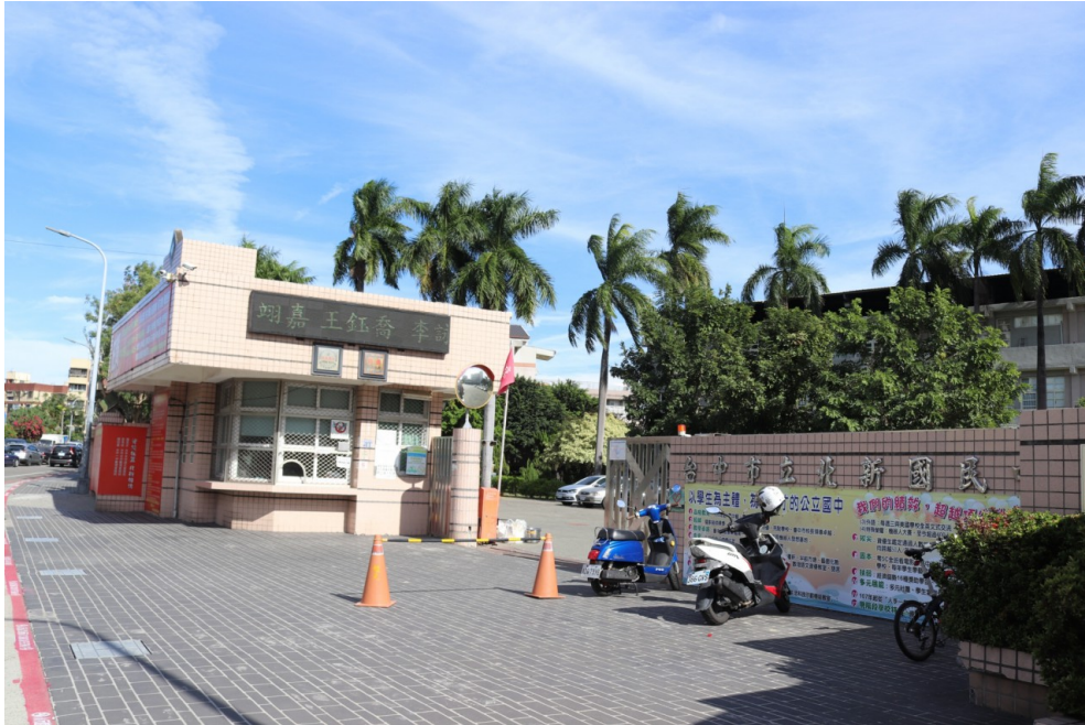
北新國中為徐吉春第一個以校長之姿服務的學校。

而現在的北新國中居然達到全校零中輟、零春暉（接觸毒品）的紀錄，著實令我這個校友感到無比吃驚。