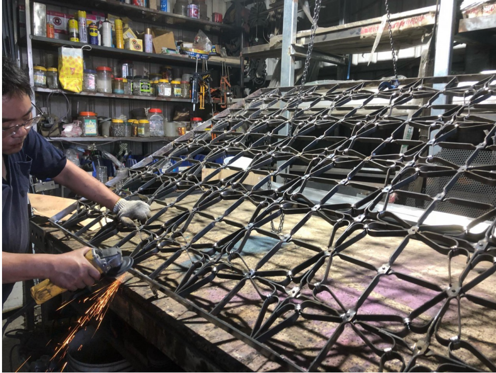
鐵工師傅在打磨鐵窗。

當時台灣的焊接技術不夠成熟，扁鐵條多以鉚釘組合固定，以黑鐵彎折而成的鐵窗花皆仰賴人力製作，早年盛行的「學徒制」使得鐵窗花的製作人力成本低，但時至今日人事成本卻是復興鐵窗花的最大障礙。昌仔說：「鐵窗花就是難在不能量產，因為每一個扭折的距離都是要經過人工計算，沒有辦法透過機器複製。」