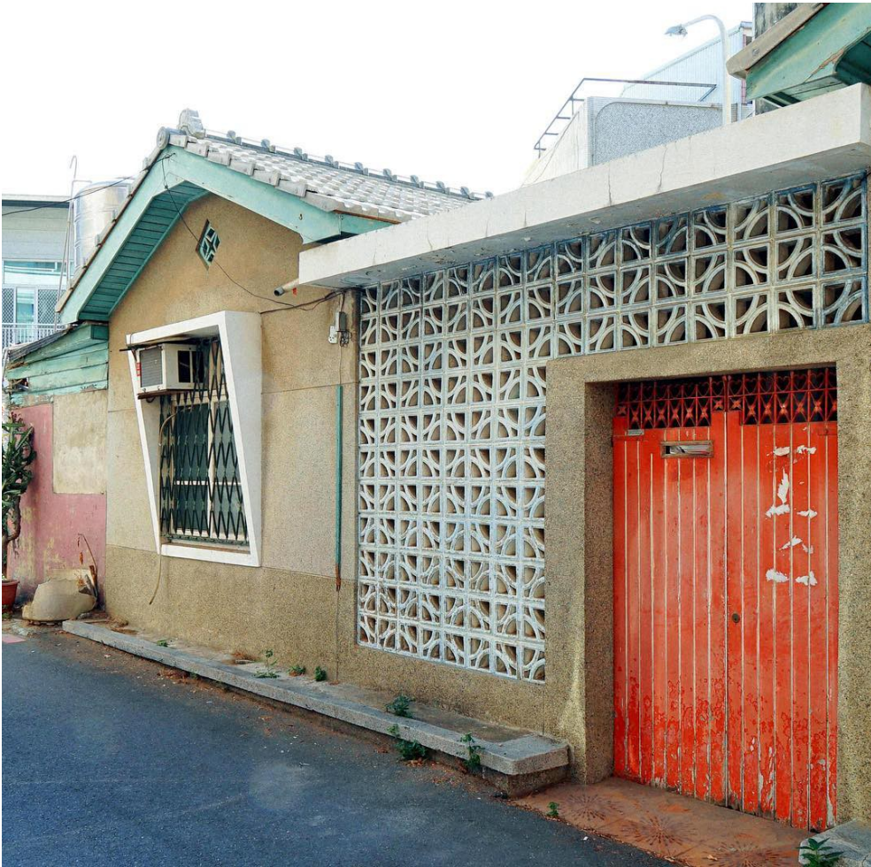
老厝的鐵窗是時代的情感記憶。