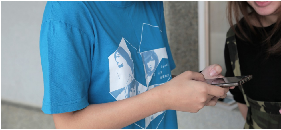
陳思羽穿著凌度C會服出席王心凌的活動。