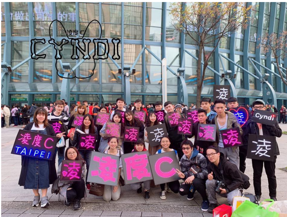
凌度C應援陣容。

歌手王心凌出道已邁入第16個年頭，演藝之路歷經不少風雨，面臨時代的轉變，當初追隨著她的粉絲們（凌寶），有人不再那樣熱衷，也有人離開了。然而至今無論甚麼活動，只要有王心凌出現的地方，一定有一群粉絲會到場力挺，其中有從出道就喜歡王心凌的人、有中途才加入的，也有近年新增的成員，團結一致只為了讓王心凌感受到滿滿的應援，他們是凌度C國際後援會（以下簡稱凌度C）。