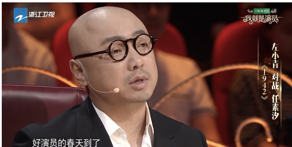
《我就是演員》導師徐崢。

《我就是演員》（《演員的誕生》第二季）中的導師徐崢一直在節目中強調：「好演員的春天到了！」很多低調有實力的演員因為外型限制、缺乏舞台展現等原因，無法被大眾熟知，透過這些競技真人秀節目，讓觀眾看見他們，並且讓觀眾知道，表演的好壞，無關外表，只要可以打動人心的，都是好表演。