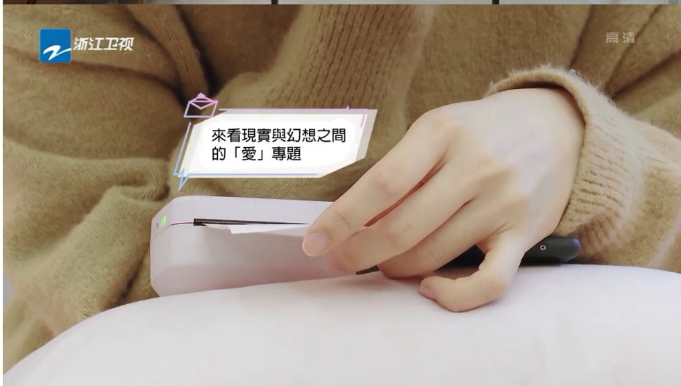
等待咕咕機傳送訊息過來的男女（上、中）和咕咕機訊息列印出來的樣子（下）。

第二，節目巧妙地設計主持人的角色，邀請六位不同年齡、不同領域的藝人擔任主持嘉賓，交流不同世代的愛情觀。每集的最後也有主持人推理主角配對的環節，會猜測主角們互相傳訊息的最終對象，讓觀眾隨著藝人們投入於節目的內容當中。例如：演員王耀慶代表著男性已婚者，他提出在婚前的戀愛經驗以及夫妻 國立交通大學機構典藏系統版權所有 Produced by IR@NCTU