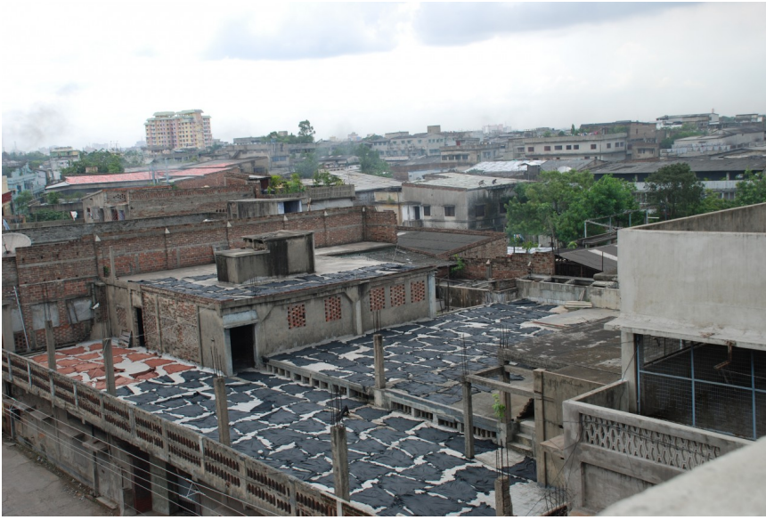
▲ 印度加爾各答塔壩展商理事會建築仍保留客家風情。