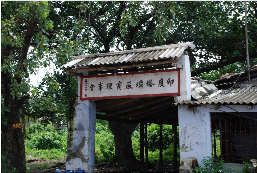
▲ 印度加爾各答塔壩展商理事會建築仍保留客家風情。