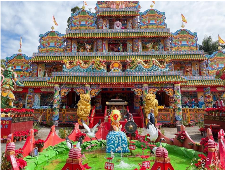
▲ 目前在臺灣已難得看見的大醮壇，只有在大的民俗活動中才會搭建。

他表示，就像本來要兩、三天才能完成的東西，忽然間靈感一來，更改製作的方法，結果變成兩天就能夠完成，而且更為安全堅固，也會讓他很有成就感。民俗手藝店在技術方面年年都一直不停在突破，並堅持保持傳統，現在也即將邁向第六代了。