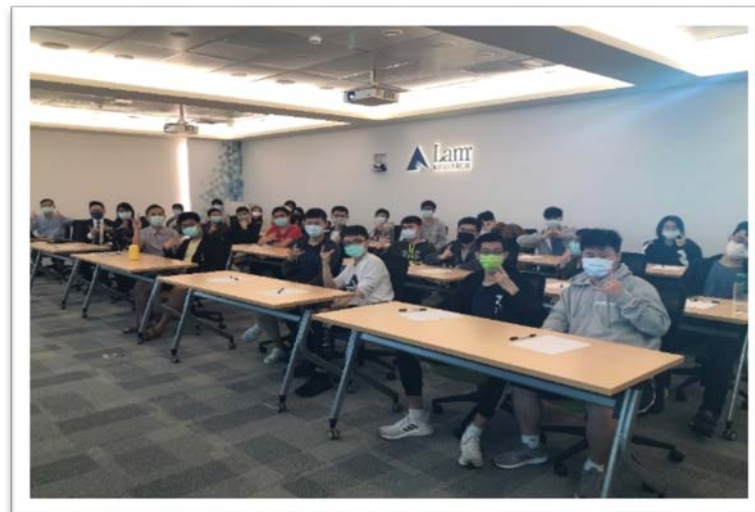
圖四、科林研發工程師培訓體驗