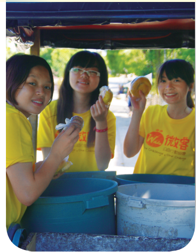
• 起了個大早，難得一見的麵包車終於來了

情由欣喜轉而猶豫，因為我想到了曾經在我家待過三年的菲傭……我希望她來，但我希望她以一個壯遊者的身分來欣賞台灣，而不是遠離家鄉成為幫傭，讓家人住進高級水泥屋，卻成為金錢的犧牲品。其實來台灣工作沒有不好，只是台灣的环境是否能給外地的工作者足夠的保護和尊重，我很沒信心。