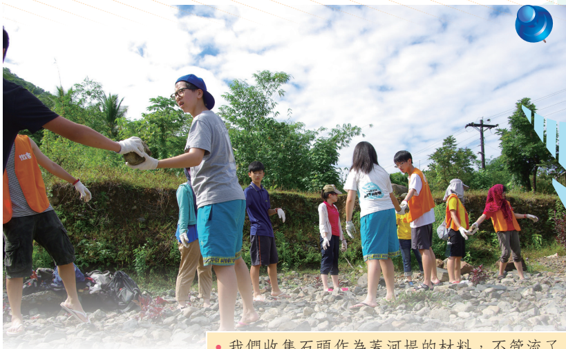
• 我們收集石頭作為蓋河堤的材料，不管流了多少汗水、黑了多少皮膚都樂此不疲