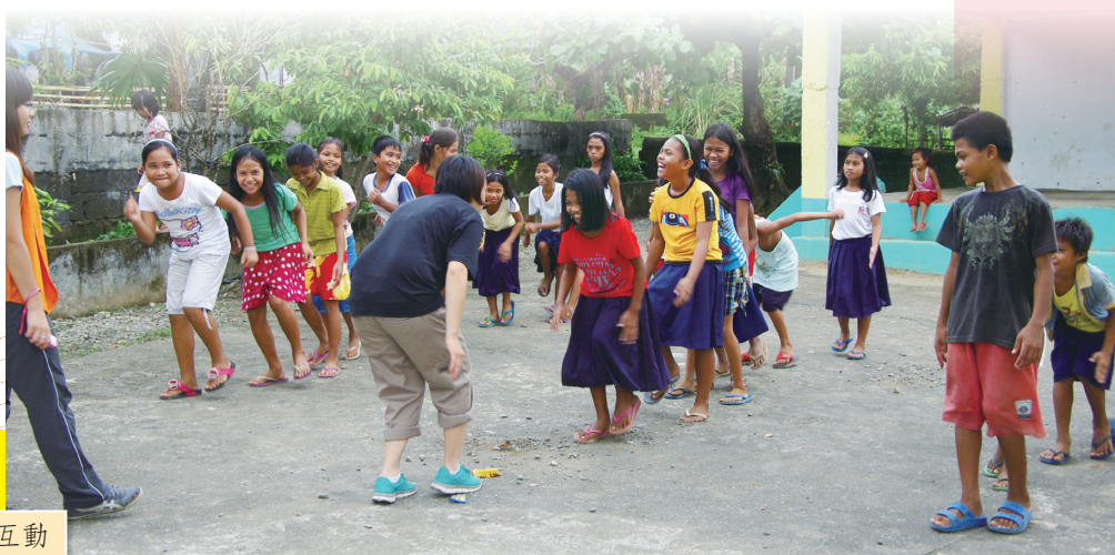
• 上課ing~~點點滴滴的互動

下課後，我總愛到廣場去，與所有的小朋友一起玩耍，聊天、彈吉他、打籃球，與他們之間深深的友誼就是這樣建立的，因為有這些相處時光，我才能夠真正了解他們的日常生活、他們的想法、他們對我們的看法，心靈交流就是靠這些自己尋來的