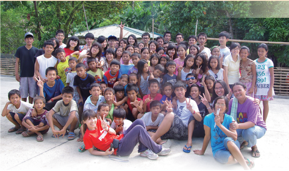
• 是你們，讓我更懂得把握當下