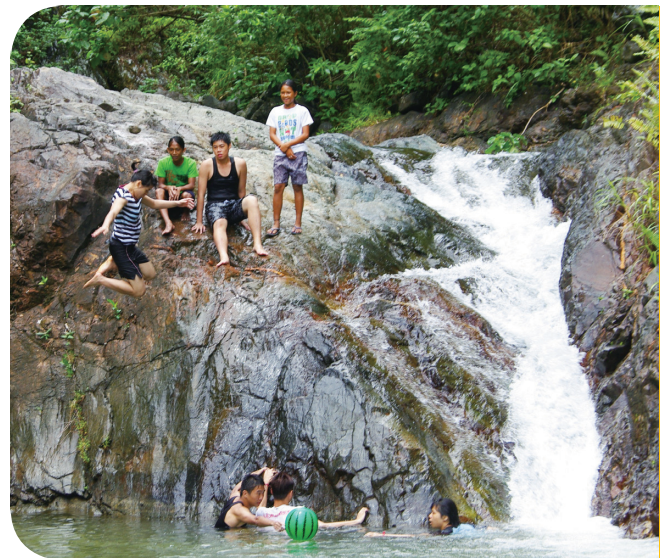
• 謝謝你們給我機會訓練自己的膽識