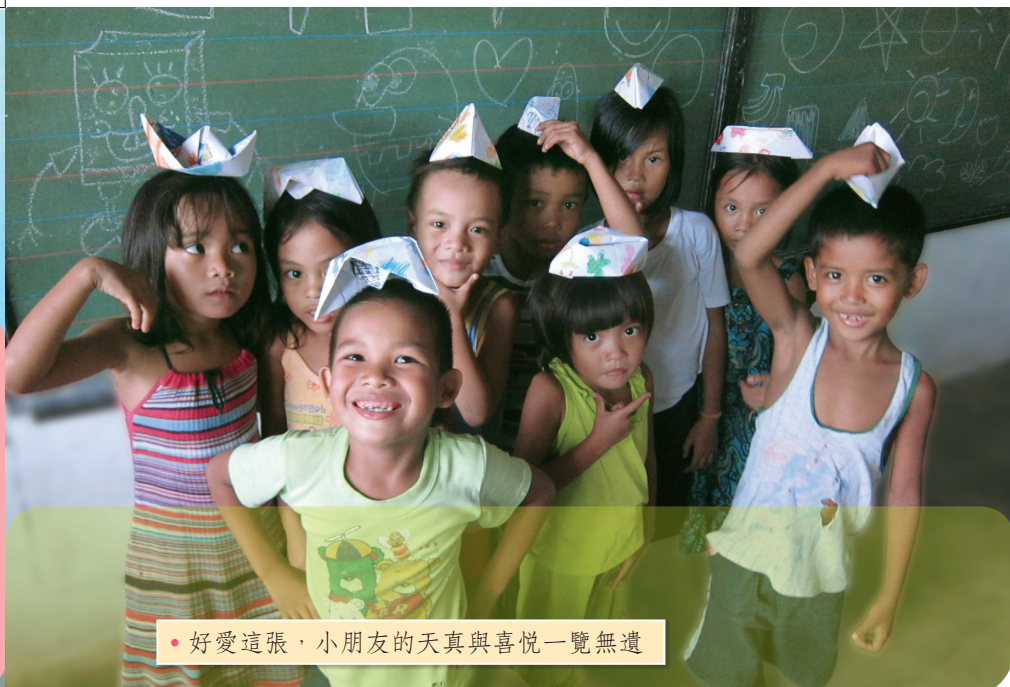
• 好愛這張，小朋友的天真與喜悅一覽無遺