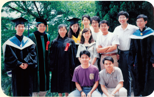
• 羅老師與實驗室學生及畢業博士生合影