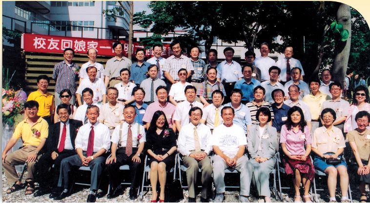
• 「校友回娘家」是羅老師當學務長時建立的制度