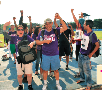
• 邱爾德國際長帶著外籍生參加台聯大足球賽