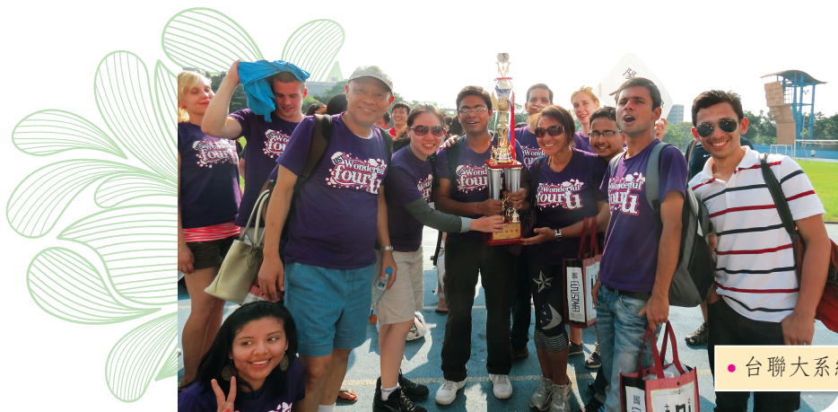
• 台聯大系統國際生足球比賽

國際化是一長久且須持續努力的目標。這幾年來，本校在姊妹校、國際學生、訪問教授及交換學生均穩定成長。未來除了在各項指標持續努力外，更期望全校師生能有更豐富的國際視野，共同努力，以培育出更多優秀的世界公民。■