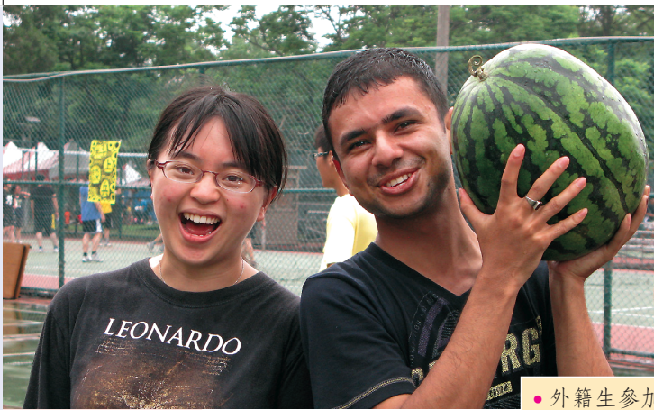
• 外籍生參加西瓜盃比賽