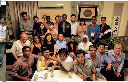
• 外籍生參加「與校長有約」活動