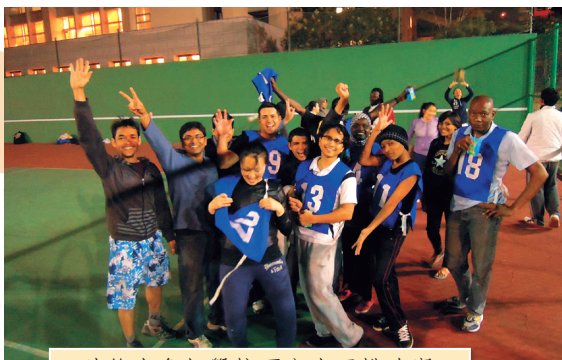
● 外籍生參加學校研究生盃排球賽