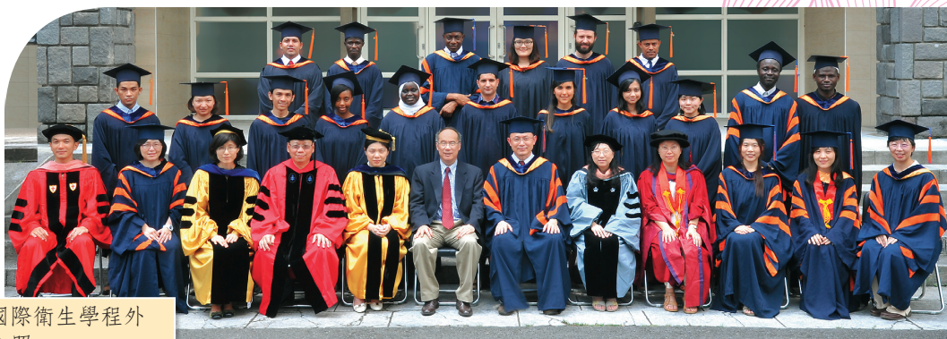
● 梁校長與國際衛生學程外籍畢業生合照

本校外籍生人數最多，也最具特色的學術單位，非國際衛生學程莫屬。國際衛生學位學程每年約有 12 ~ 13 位國際學生前來修讀公共衛生。無論從師資、課程、乃至生活輔導，皆贏得極高肯定。國際學生之中不少