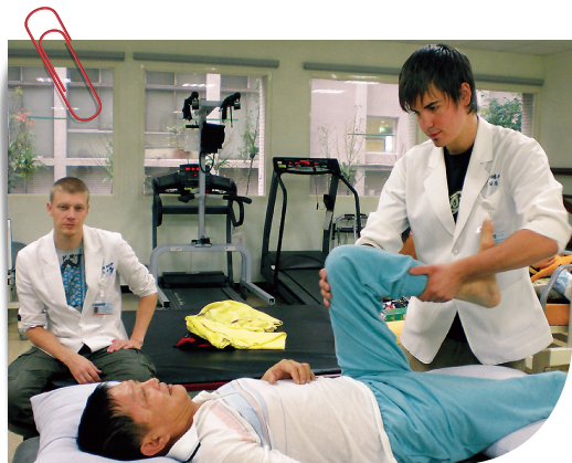
● 姐妹校芬蘭 JAMK 交換學生至本校物輔系實習

陽明是一所以生物醫學為主的研究型大學，我們目前的學生總人數，尚未達五千人。我們招收外籍生，宜以「質」為主，不太可能以「量」取勝。怎麼樣用有限的資源招收高品質的外籍學生，是我們的挑戰。以前學校招收外籍生除了由政府相關單位直接提供的各種獎學金之外，只有全額陽明獎學金一途，沒有其他選擇。我擔任國際長之後，建議學校在招收外籍生時，增加一個選項～「如果沒有獎學生金，你是否願意來陽明大學就讀？」。大概有一半的外籍生會勾選願意。如果該名外籍生成績非常優秀，我們仍然可考慮給予全額獎學金。成績還不錯者，我們可給予部分獎學金，也就是只補助其學雜費。