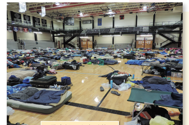
• 體育場百人大通鋪

團隊住宿的地點是學校體育館，百人打地鋪的情景蔚為奇觀！一天的行程從白板公告開始，比賽日通常是早午兩個練習時段，一個半小時的 EPL (Eat, Pack and Leave) 時間中，隊員們要迅速吃飯、洗澡、換裝化妝，並將所有的行李(包括樂器、道具)通通打包上車，前往比賽場地。賽後又一次匆匆的 EPL(此時約已晚上十點)，即使比賽完渾身黏答答，也得要隔天下午團練結束才能再次擁有打仗般短促的洗澡時間。接著，車隊繼續風塵僕僕往七八小時車程的下一城市移動，得學會在車上享有安穩睡眠