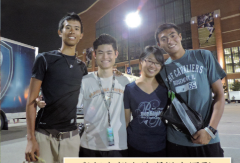
• 與好友們在決賽場大團聚