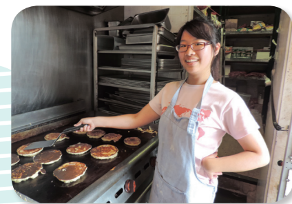
• 煎700片鬆餅是家常便飯

從未下廚的自己跟著主廚慢慢學習，從幫忙拿罐頭、擺盤，到切洋蔥番茄(一切就是30個起跳)，漸漸可以獨力完成所有早餐、煎700片