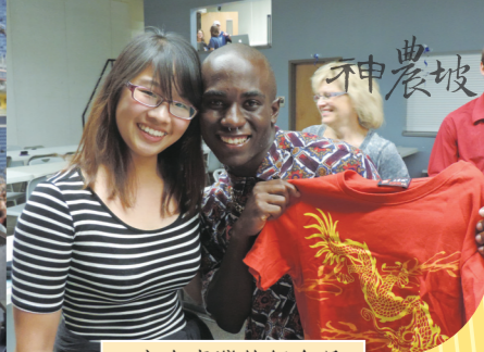
• 來自臺灣的紀念品

的功力，用巡迴馬戲團來形容真是再貼切不過了！整個車隊包含：三輛大巴(150位團員)、一輛小巴(20位教練)、一台RV露營車(執行長)、兩輛休旅車(行政團隊、志工)、兩輛16輪大貨櫃車(餐車、樂器車)，在公路上一字排開兼具氣勢與紀律。