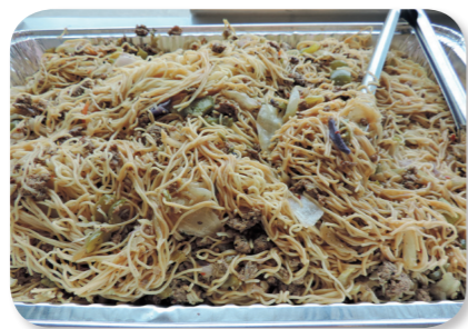
• 我做的 Yakisoba 日式炒麵！