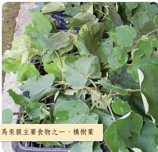
●馬來貘主要食物之一，構樹葉

除了刻板行為，動物最常見的問題便是生病，動物園中有專門的獸醫為牠們檢查身體，不過在檢查之前總得讓牠們靜下來，小型的動物還好，但園中可不乏中型以及大型的動物，實習第一天我就看過為了替一隻小羚羊做健康檢查，三、四名大哥吃力地將牠制伏住，同時還得注意不被牠的角傷到，一隻小羚羊尚且如此，何況其他動物？雖然說避免危險，大型動物（犀牛、長頸鹿、猛獸等）會直接麻醉而