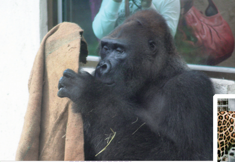
• 人工眷養的野生動物會出現「刻板行為」