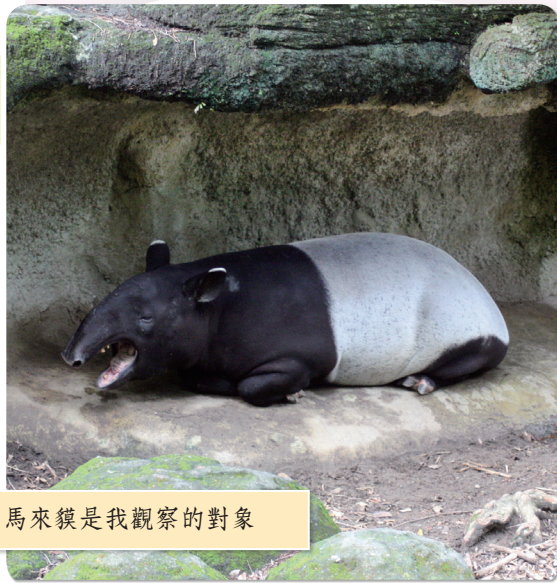
●馬來貘是我觀察的對象