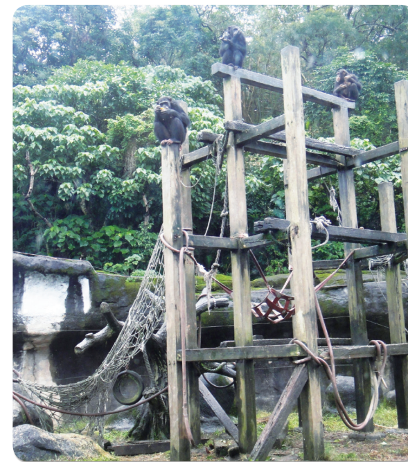
• 增加新設施、簡單玩具，讓動物生活豐富化

性尚存的野生動物，被眷養在人工的環境中，能出的問題千奇百怪，其中最常見的問題便是刻板行為。