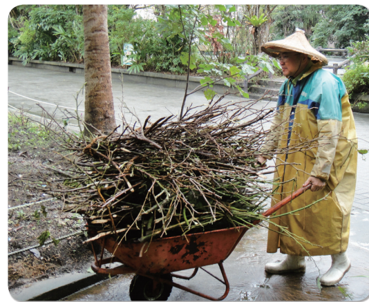
• animal keeper 正在工作

通常稱動物園負責動物起居的人為「animal keeper」，他們的主要工作除了餵食以及打掃，更重要的是觀察動物的狀況，養過寵物的人肯定知道照顧牠們是多麼費神的事。keeper 每天要照顧