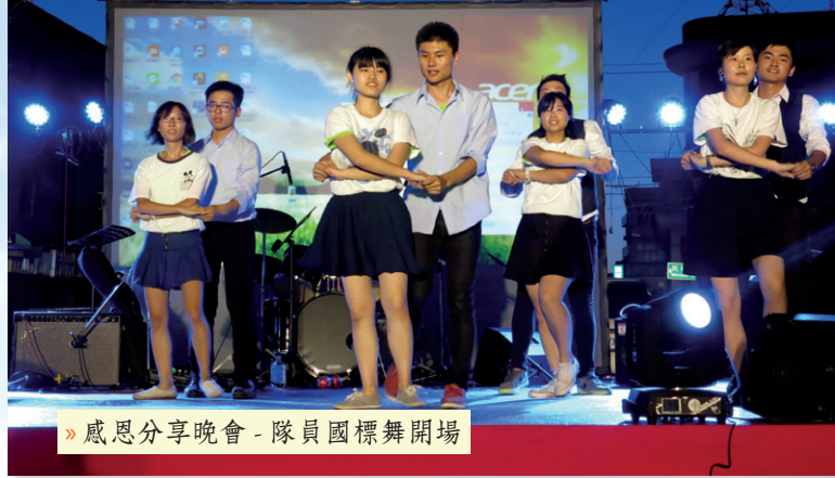
» 感恩分享晚會 - 隊員國標舞開場