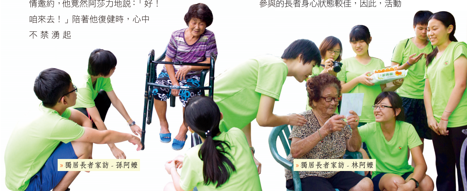
» 獨居長者家訪 - 孫阿嬤