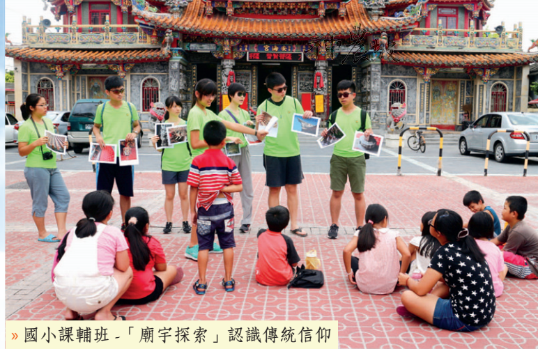
» 國小課輔班 - 「廟宇探索」認識傳統信仰