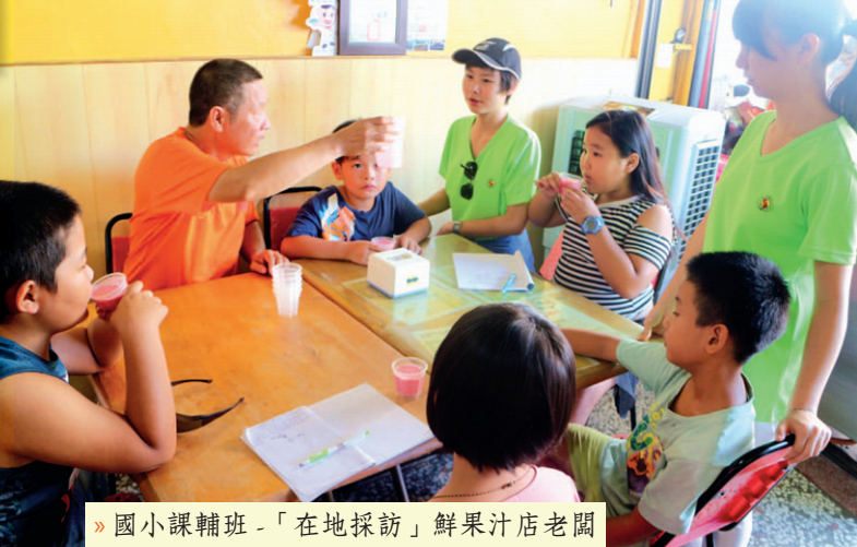
» 國小課輔班 - 「在地採訪」鮮果汁店老闆