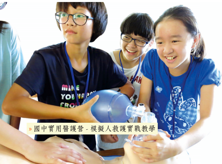
» 國中實用醫護營 - 模擬人救護實戰教學

在陪伴過程中，我們見到原本自暴自棄、對未來沒有設想的小孩敢大膽做夢；並且在我們制止傷人傷己的舉動，和鼓勵他們以溫和方式來表達下，部分小孩漸漸遇到挫折後能收斂原始的情緒反應，轉以口語或是藝術創作來抒發。此外，在惜別活動中，孩子不僅能欣賞自己的好，還能誇獎別人的可愛處。這讓我知道，我們其實是希望種子的散播者，