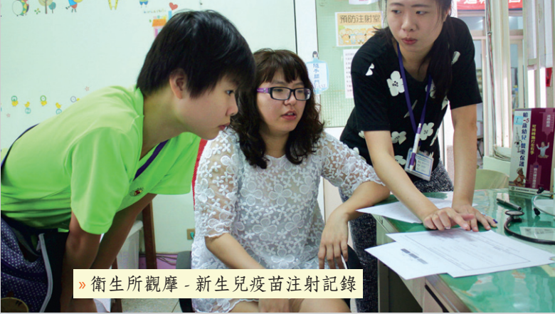
» 衛生所觀摩 - 新生兒疫苗注射記錄