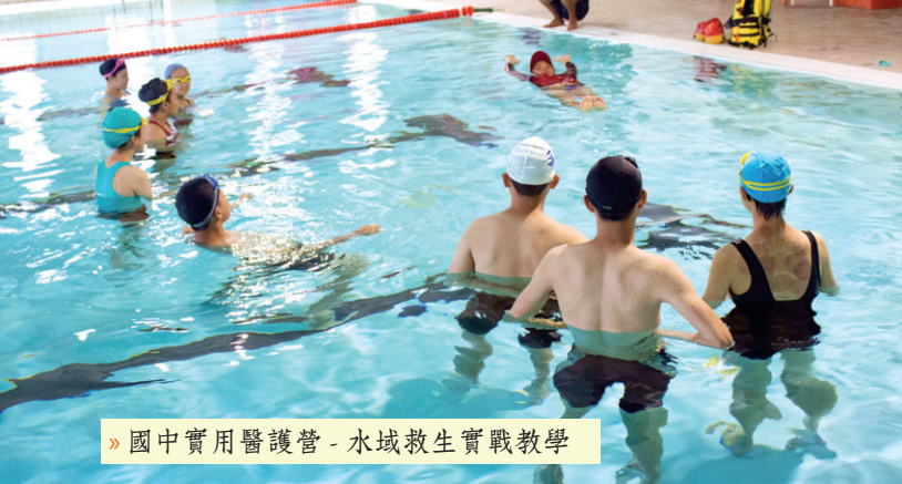
» 國中實用醫護營 - 水域救生實戰教學