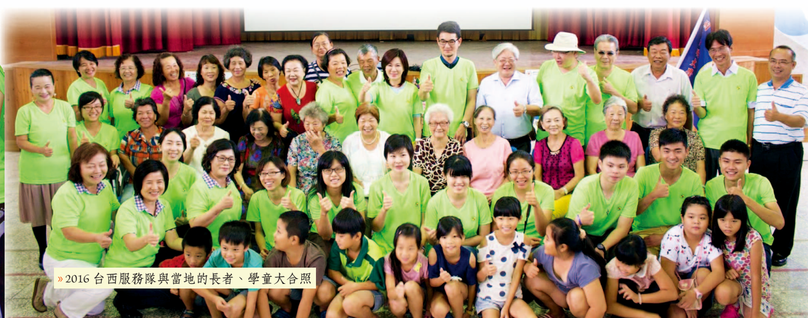
» 2016 台西服務隊與當地的長者、學童大合照

身為台西服務隊的隊長，我由衷希望這種關懷能永續長存，因此我們除了設立「心繫 235 公里，陽明 × 台西」FB 粉絲專頁，提供一個遠距離的交流平台，讓當地小朋友可以與我們互動，也定期分享服務過程中體會到的台西美好回饋給當地人；我們也實地回訪，再次親臨這片土地。這樣，看似微不足道的基層服務，才能真正達成台西服務隊創隊的初衷。——