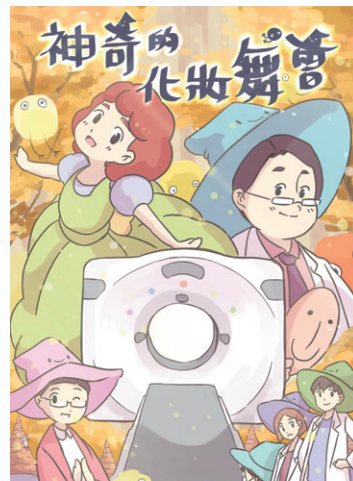
» Nikumon 的作品：漫畫《醫生哪有這麼萌》、《慾望女醫》（圖／遠流出版社提供）；繪本《神奇的化妝舞會》（圖／Nikumon 提供）