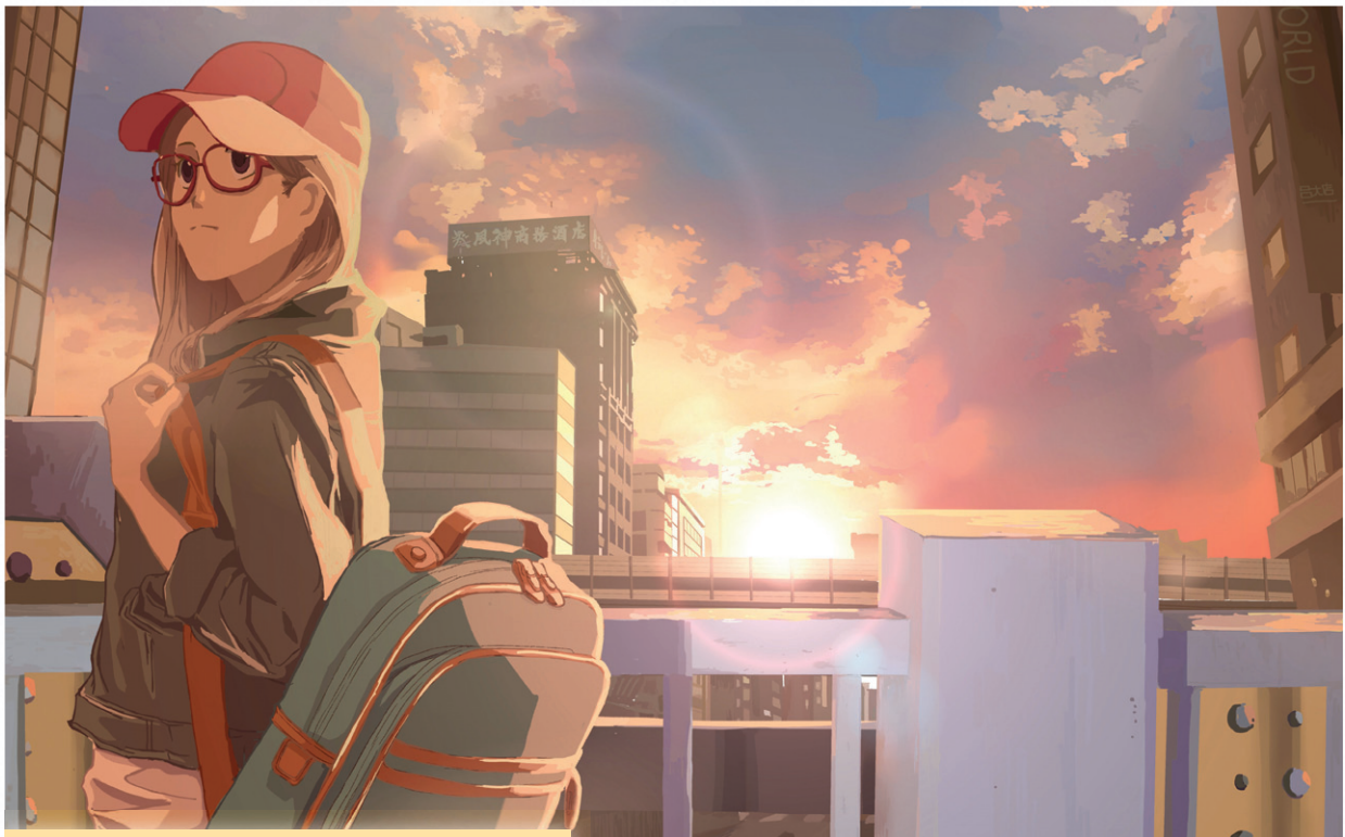
» Nikumon 的插畫作品

Nikumon ：對我來說，醫生是一份工作，把它做好是因為責任。行醫之餘的創作，則是休息，也是一個打氣的方式，因為工作實在太容易遇到挫折了，需要畫畫給自己力量。那為什麼不放棄醫生工作去畫畫呢？我想把最喜歡的東西放在純粹的空間裡面，不會因為經濟壓力迎合大眾口味——我需要把它保護好，因為它是我力量的泉源。■