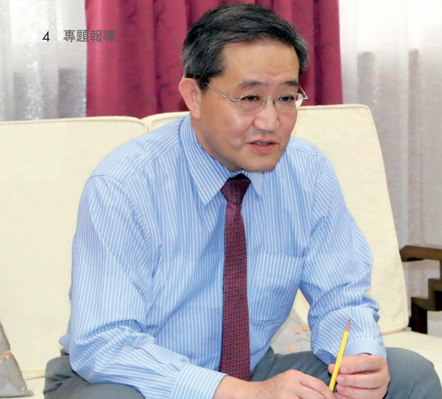
▲ 面對學生會的提問，郭校長以開放誠懇的態度回應