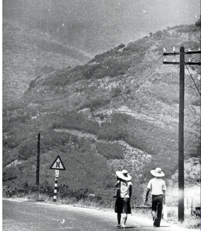
▲ 郭校長當年為十字軍留下的影像紀錄

郭校長先後曾經在衛生署（現已改制「衛生福利部」）與疾病管制局（現已改制「疾病管制署」）服務過，參與過國內最大的防疫體系轉型，將原本衛生署防疫處、預防醫學辦公室、以及檢疫總所多頭馬車的三個單位，組織再造為現在的「疾病管制署」，一舉解決國內防疫多頭馬車、政令不明的問題。