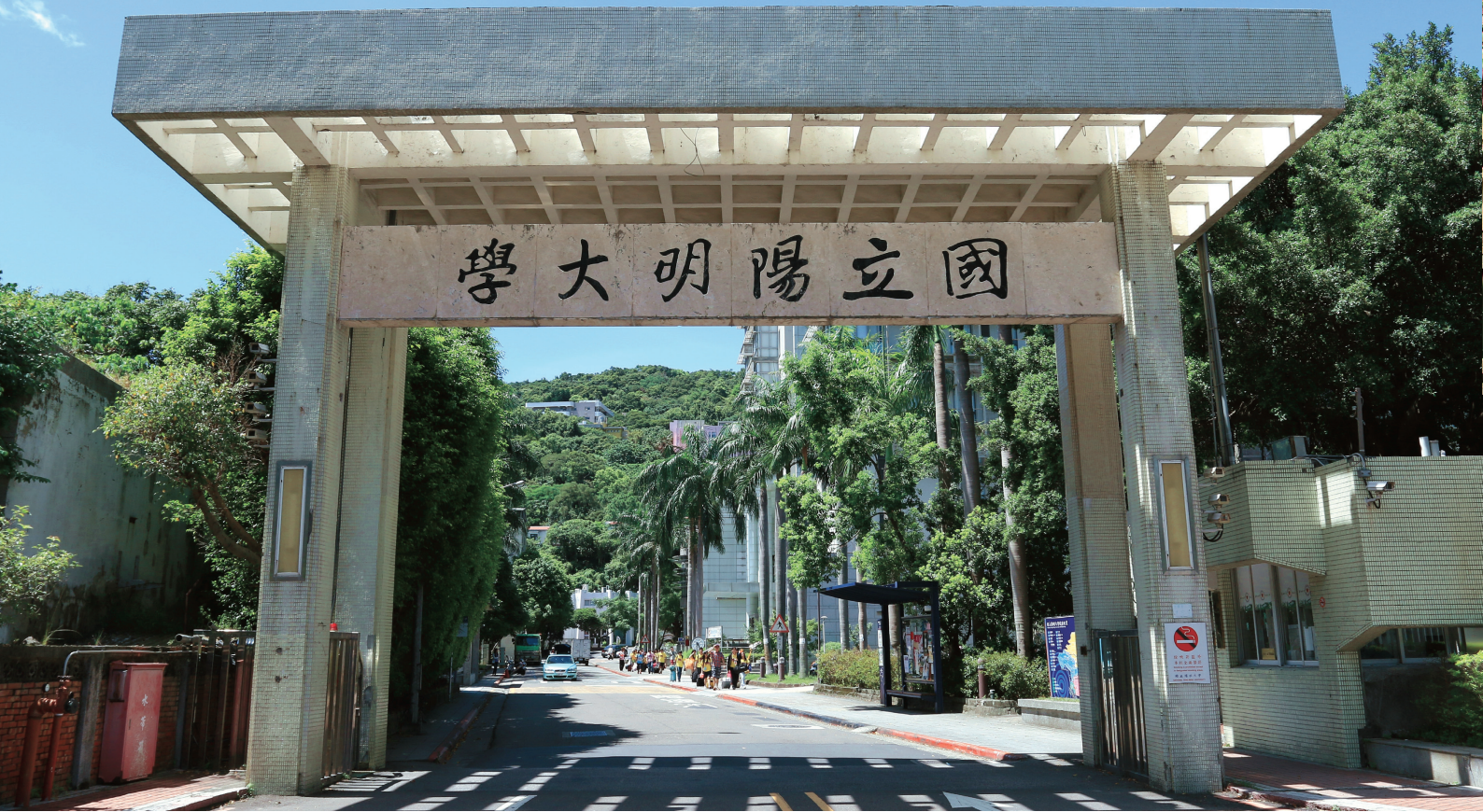
▲ 走過將近半世紀，校園內一些建築也留下歷史痕跡