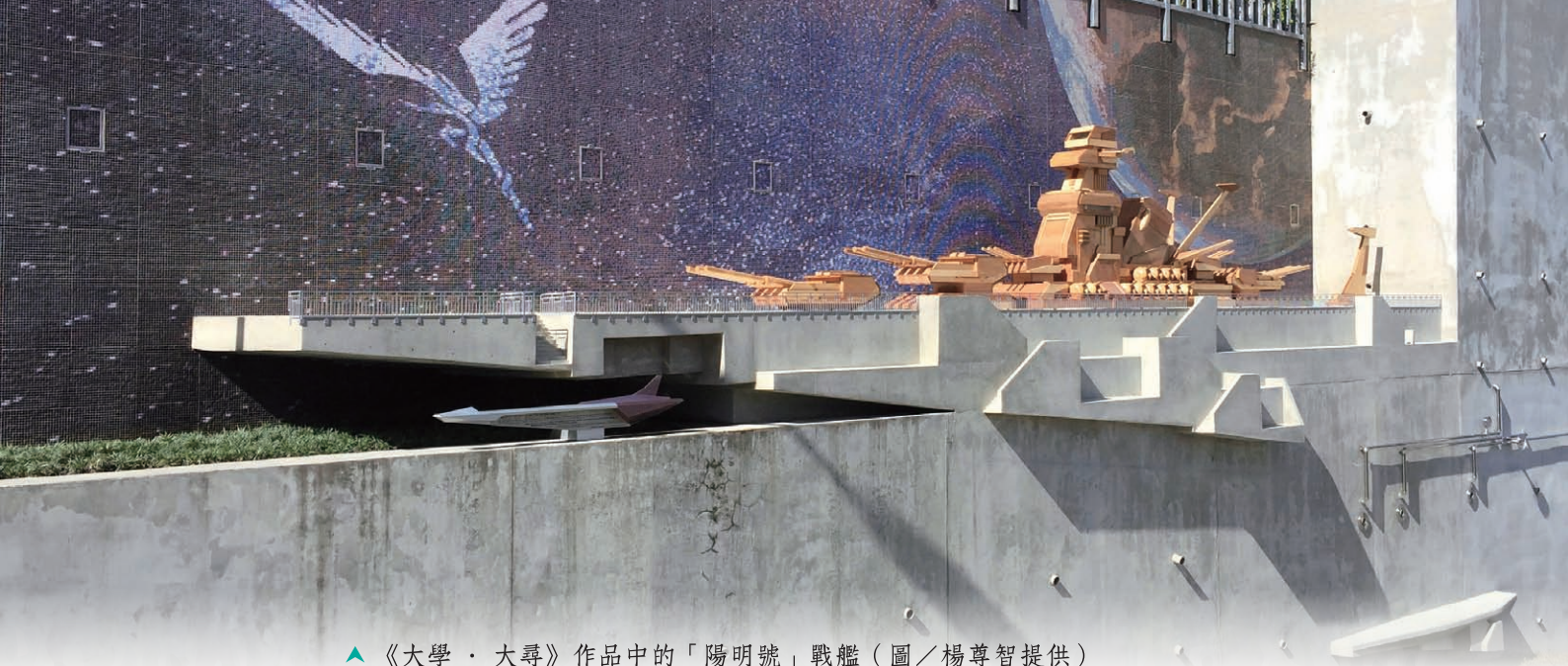
▲ 《大學·大尋》作品中的「陽明號」戰艦