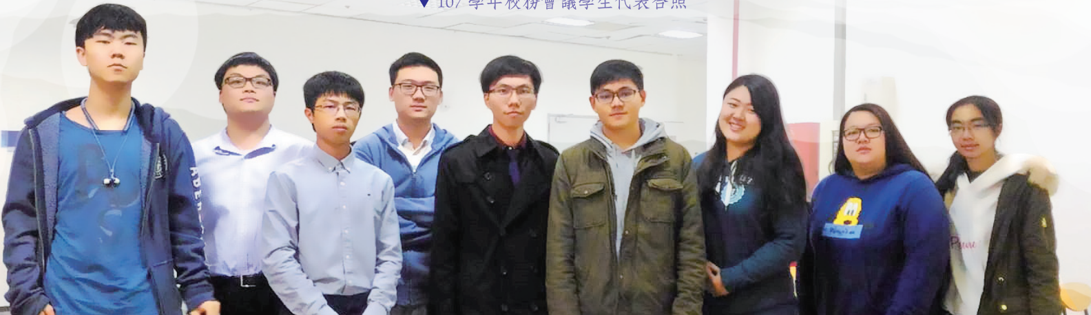
▼ 107 學年校務會議學生代表合照