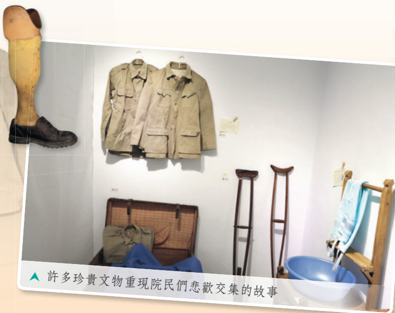
▲ 許多珍貴文物重現院民們悲歡交集的故事