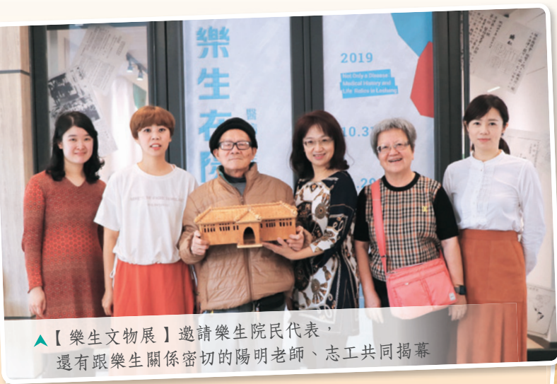
▲【樂生文物展】邀請樂生院民代表，還有跟樂生關係密切的陽明老師、志工共同揭幕

院民至今記憶鮮明的是，樂生保留自救會的第一場校園講座就是在陽明大學舉辦的，當時同學們的關注與迴響，給予這些長期受疾病污名而卑怯的阿伯阿姨們很大的鼓舞，他們才有勇氣以一場又一場的講座，對官員、學生以及來到他們身邊的人們，敞開心胸述說自己的故事，與保留樂生的盼望。