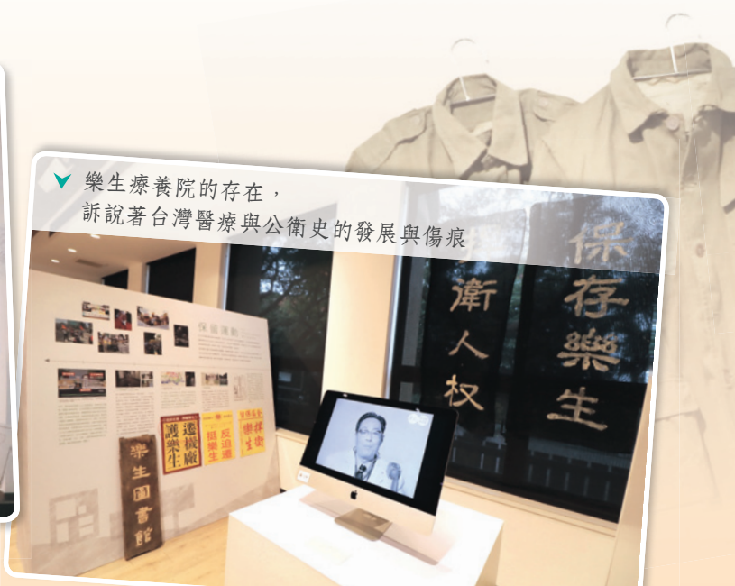
▼ 樂生療養院的存在，訴說著台灣醫療與公衛史的發展與傷痕