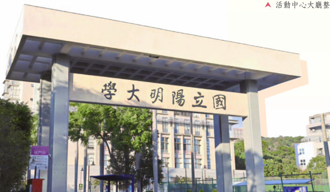
◀ 整新後的校門口牌樓在合校後將維持原樣，以保留為陽明歷史建物