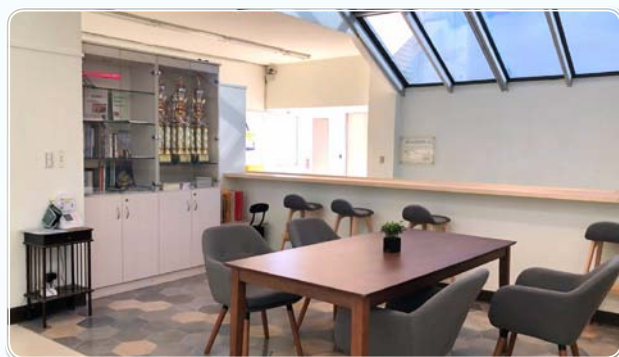
▲ 四樓新設休息區