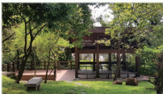
▲ (上) 韓園改造為四季花香的紀念花園 (中) 張曉風老師題字石台改為立體式 (下) 鄰近榮陽隧道的涼亭整建為「榮陽亭」，象徵陽明與榮總密切關係