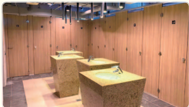
▲ 男三舍新增性別友善廁所

早年興建的女一舍、女二舍及男三舍，至今已分別超過40、36、32年歷史，過去雖曾多次進行局部修繕，但公共空間及浴廁老舊，以及走廊、樓梯間積水問題都亟需改善。此次配合教育部「50年50億學生住宿環境提升計畫」辦理，徹底解決原有問題，並大幅翻新設施，將能提供更優質舒適的住宿環境。男三舍浴廁已於本學期完工，女一舍、女二舍將於明年暑假動工。