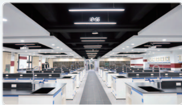
▲ C3實驗室改建後嶄新面貌