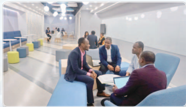
▲ 醫學二館新設交誼廳