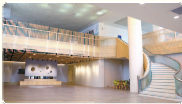
▲ 活動中心大廳整修後現代典雅風貌