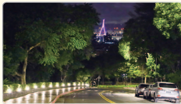
▲ 真知路沿線燈光帶