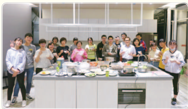
▲ 多功能的人良閣 (圖/學務處提供)

屋齡已42年的學生餐廳，這次除了整體重新設計、裝修，同時進行壁癌、漏水處理以及大拉皮，包括外牆、屋頂都進行防水處理，地坪也全部翻新，希望能讓學餐強身健骨、改頭換面。整修完工的學餐改名為BEATA (拉丁文「最快樂幸福的人」)，也轉型為多功能空間。其中，新添了多種設施的三樓空間，命名為「人良閣」，可供師生舉辦講座或聚餐、聯誼等活動。