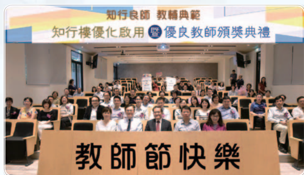
▲ 知行樓啟用儀式，於2018年教師節頒獎典禮上舉行