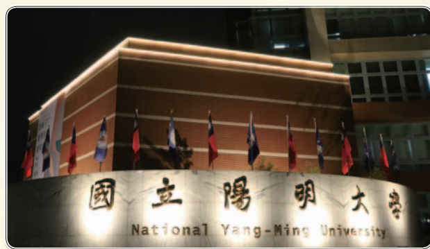
▲ 守仁樓正面夜間照明

此外，從校門口牌樓、守仁樓正面和活動中心迴廊，還有真知路(親山步道)沿線到榮陽隧道口，以及位於東北角、從石牌捷運站可遠眺的生醫工程館兩層頂樓，也加裝照明燈光，形成一條校園燈光帶，除了加強夜間照明，也增加校園的導引性。