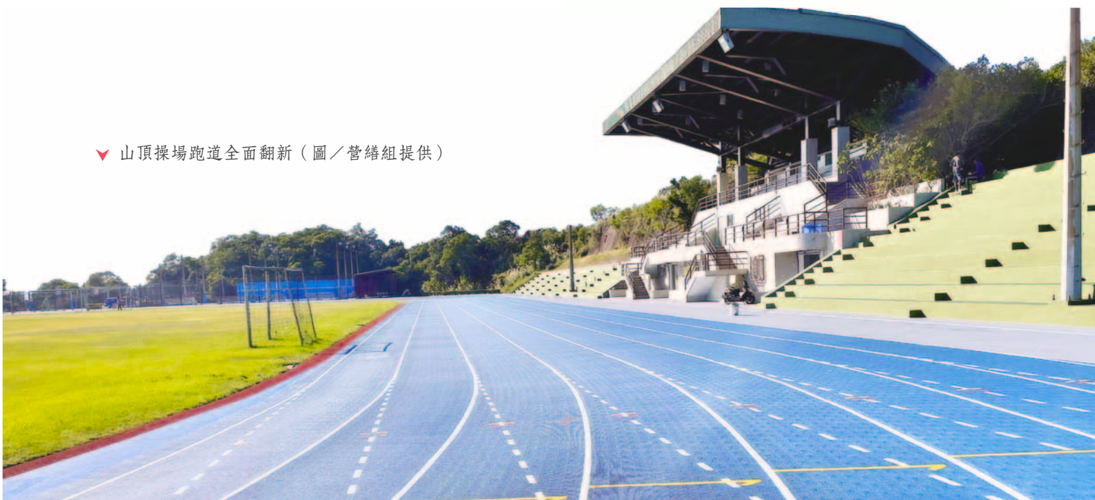
▼ 山頂操場跑道全面翻新