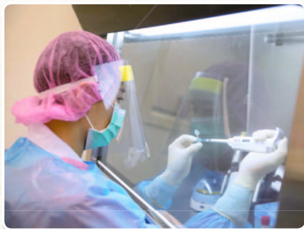
▲ 新冠病毒屬第五類法定傳染病，必須在第二等級負壓實驗室內操作，圖為陽明附醫 P2 實驗室

陽明大學為解決偏鄉醫療而創校，四十五年來，服務社會、解決國家問題的基因在陽明人內