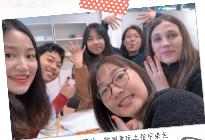
▲ K-lounge 韓國文化體驗～韓國童玩之指甲染色

學校的107棟建築物為學生會館，裡面有各式各樣的社團，可以主動敲門詢問是否願意讓交換生加入。我參加的社團為音樂性社團「누