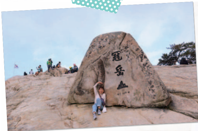
▲ 位於首爾南方的冠岳山

謝謝學校給予的交換機會，讓我能夠在畢業前到韓國體驗不同的文化，也讓我發現自己的不足。像在和外國人交流時，體悟到第二外文的重要性；還有面對問題時，必須主動詢問並解決問題。期許自己能夠帶著交換期間所體會到的事物，讓未來的自己變得更好、更獨立！