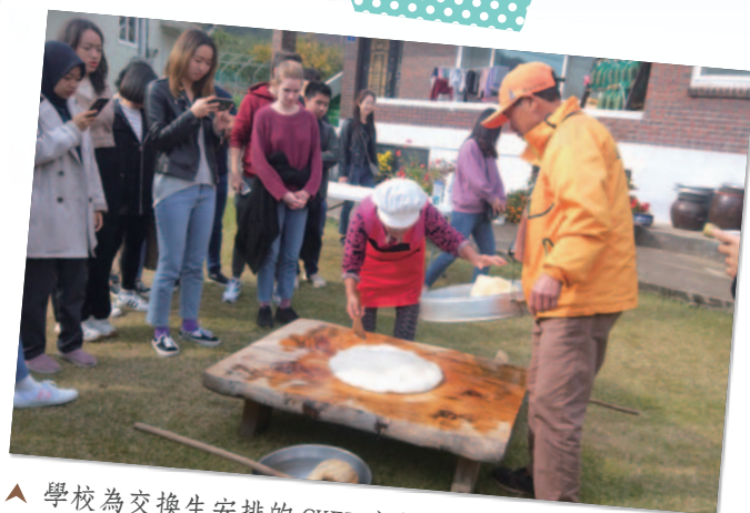
▲ 學校為交換生安排的 CKEP 文化旅遊活動「搗麻糬」

리울림」。社團有為新手安排課程，老師是社團內的學長姊。我很幸運的遇到了一個英文很好、很有耐心的吉他老師！在學期初會有社團MT，類似於台灣過夜版的迎新活動；學期末則會有期末表演，地點位於弘大商圈的bar，而我也在台上表演了兩首曲子，真的是一個很特別的體驗！