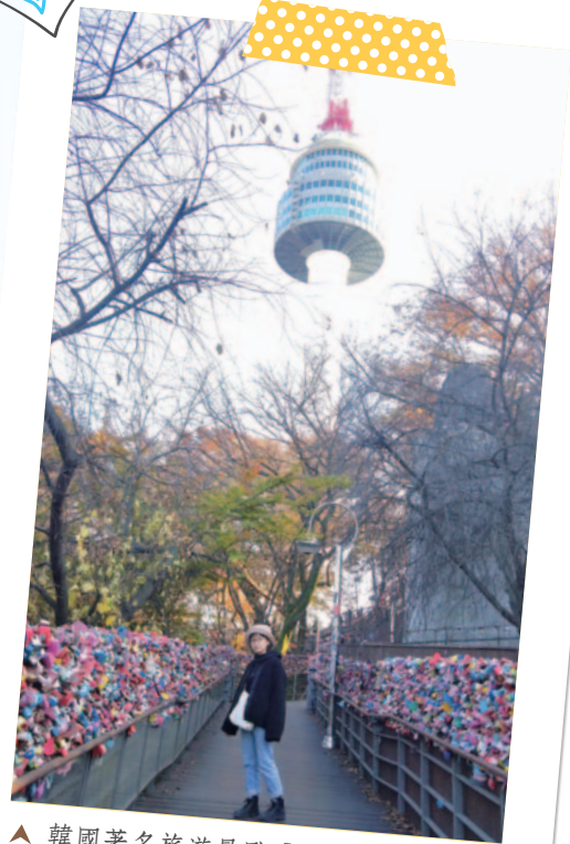
▲ 韓國著名旅遊景點「首爾塔」

謝謝學校給予的交換機會，讓我能夠在畢業前到韓國體驗不同的文化，也讓我發現自己的不足。像在和外國人交流時，體悟到第二外文的重要性；還有面對問題時，必須主動詢問並解決問題。期許自己能夠帶著交換期間所體會到的事物，讓未來的自己變得更好、更獨立！