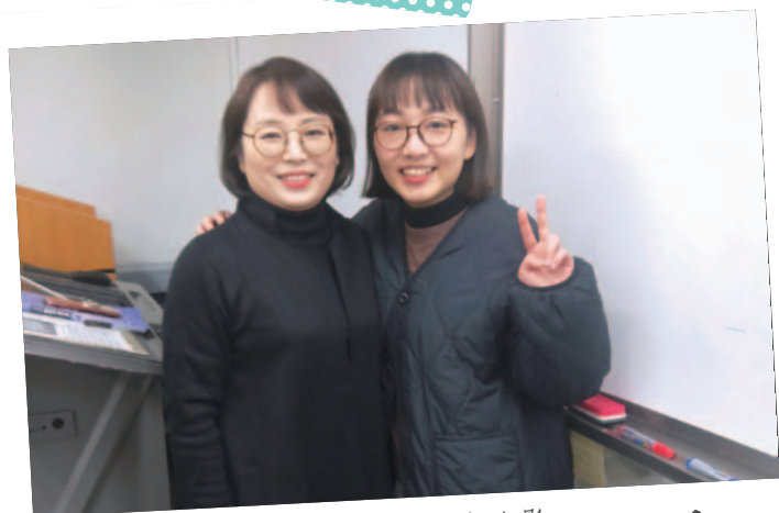
▲ 與最喜歡的中文會話課老師（左）合影

「中文會話課」其實是一門另類的超高級韓文課。我原本的如意算盤，是在課程中結交擅長說中文的韓國朋友，並且一舉成為此門課的榜首。殊不知，老師要我們背每一課的韓文課文，期末考則是背一百句的韓文翻譯，對於韓文新手的我實在是晴天霹靂！但也因為這門課，我學到了更多的韓文，也如願交了許多韓國朋友。