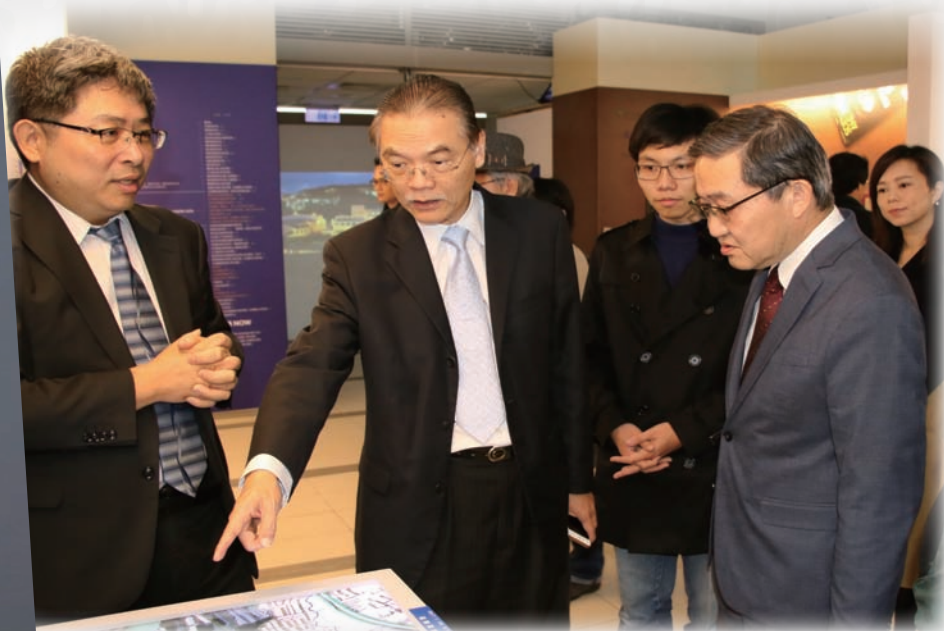
▼ 郭館長（左）為開幕來賓解說展出內容

常設展區以陽明大學的改名為分界，闡述唭哩岸的地景與陽明的創建，對基層醫療的許諾與校園民主的發展；到加入台灣聯合大學系統，以基因定序與腦內解謎打造「唭哩岸旁雙卓越」；更在近年發展為放眼國際，連接產學，頂尖卓越的研究型大學的歷程。由於空間有限，無法將四十多年的校史盡數展示，因此有特展區的設計。希望未來能依主題或人物方式規劃展覽，將靜態文物轉化成有血有肉、可以分享與感動的記憶。