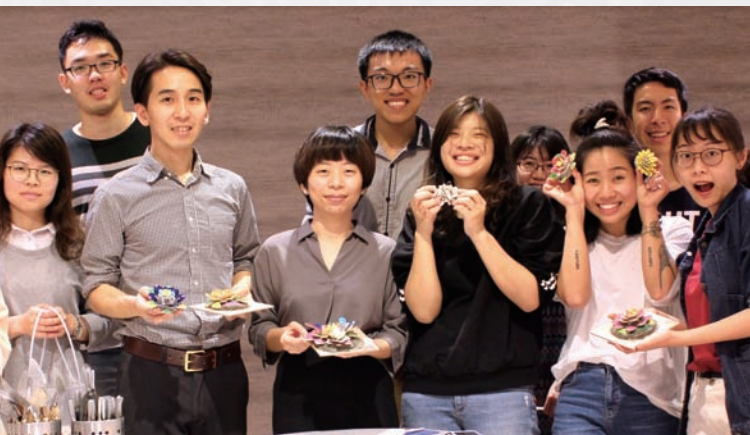
▲ 「剪黏藝術工作坊」學員與作品