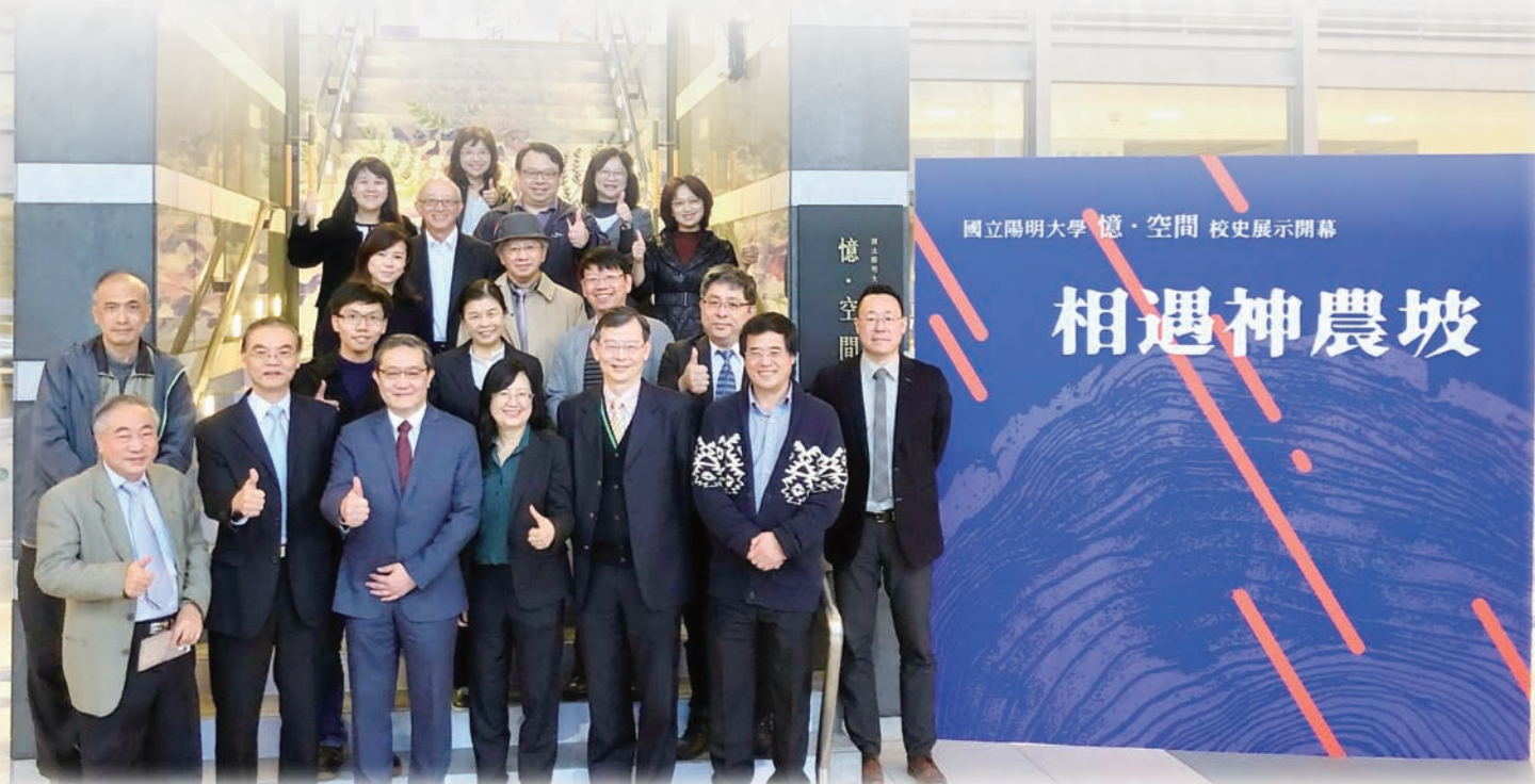
▼ 「憶·空間」開幕儀式貴賓合影

現在，陽明圖書館不只有冰冷的書，還有溫熱的記憶與願景。經過圖資大樓時可別急著上山，找個時間到裡面看看陽明的軌跡。走一走，拍個照，聊一聊，讓校史成為你生活的一部分，也讓你成為陽明人共同的歷史。■