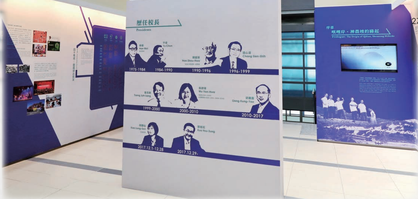
▲ 「憶·空間」設有三個常設展區與陽明圖書館史特展區

在「憶·空間」之後，圖書館將繼續秉持求真求實的精神優化圖書館，在 2019 年規劃更多校史研究與教學的空間。具體而言，我們在五月配合校友回娘家活動，將圖書館一樓門廳重新整理。另外，圖書館三樓南棟也預計轉型成為以教學與靜態展演為中心的多功能場域，希望在年底完成。讓校友與在校師生能在此共同緬懷學校一路走來的筆路藍縷、蓬勃生長與開花結果，並