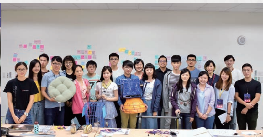
▲ 「樂齡設計工作坊成果展」學員與作品