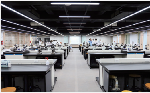
▲ 整建後的 C2 實驗室