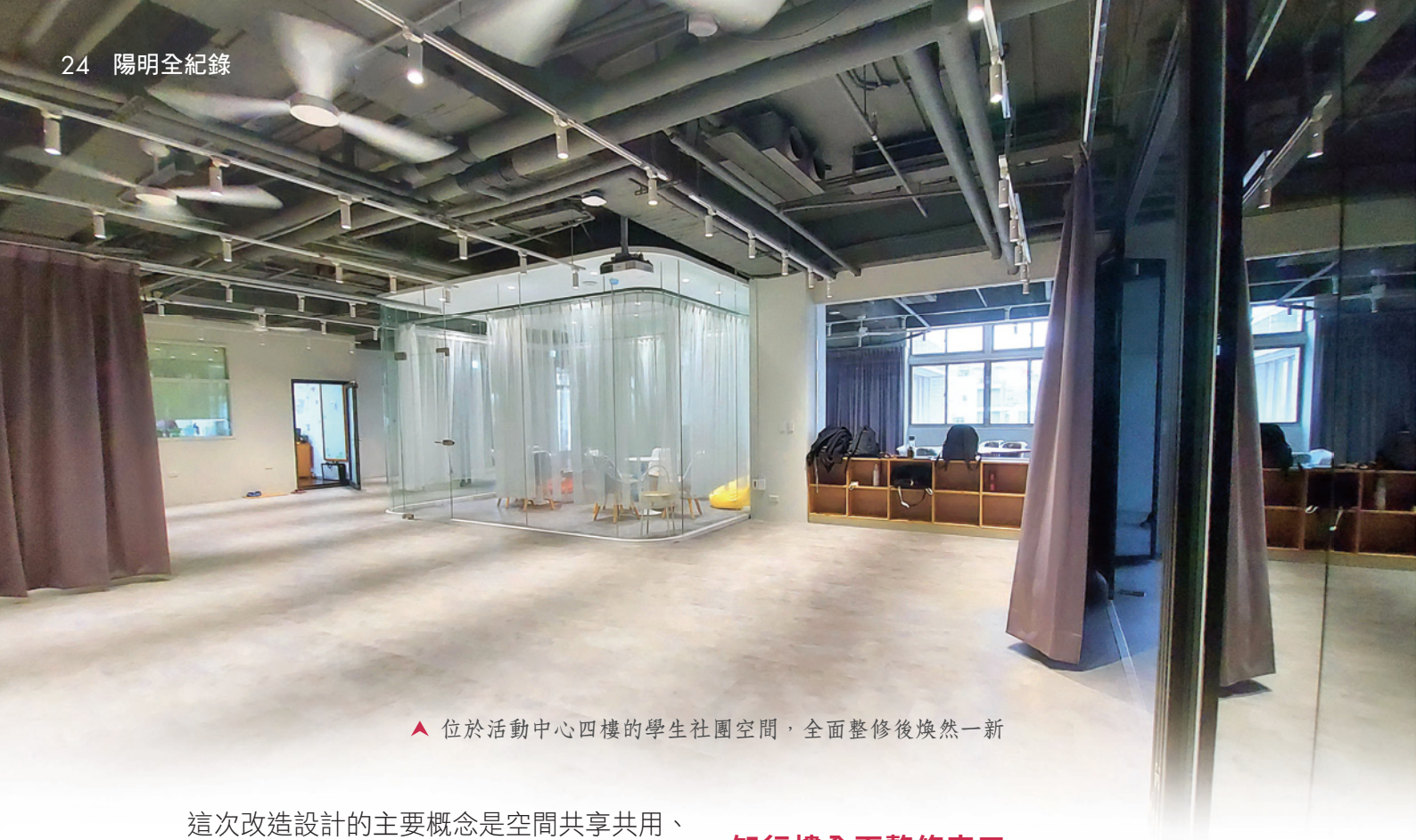
▲ 位於活動中心四樓的學生社團空間，全面整修後煥然一新

這次改造設計的主要概念是空間共享共用、共學共創，因此在公共區域的設計上讓空間盡量打開，並增加空間的豐富性與趣味性；讓四活除了作為社團使用，也能增加交誼、休憩和討論等多元使用的可能性，以滿足經常出入這裡的學生的各種需求。另外一大特色，是為愛跳舞的陽明同學增設了許多鏡面空間，讓同學們可以盡情發揮才藝！而在學生社團辦公室區域，也同樣增設了許多討論、休憩與交誼用的桌椅，並且全區重新粉刷、製作專屬系統櫃以及增加室內照明，讓同學們可以享用更為舒適美好的社團空間！