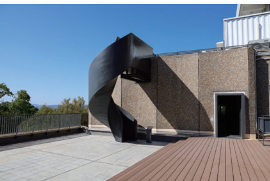
▼ 四樓露臺活動空間