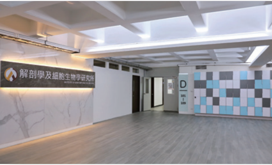
▲ 系所招牌與指標系統全面替換