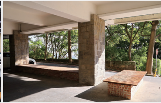
▲ 改善後的一樓人行步道

各樓層梯廳還增設討論區，並將原來放置在走道的實驗用冰箱移到機房，讓整棟大樓徹底改頭換面，賦予現代化的全新面貌與機能。