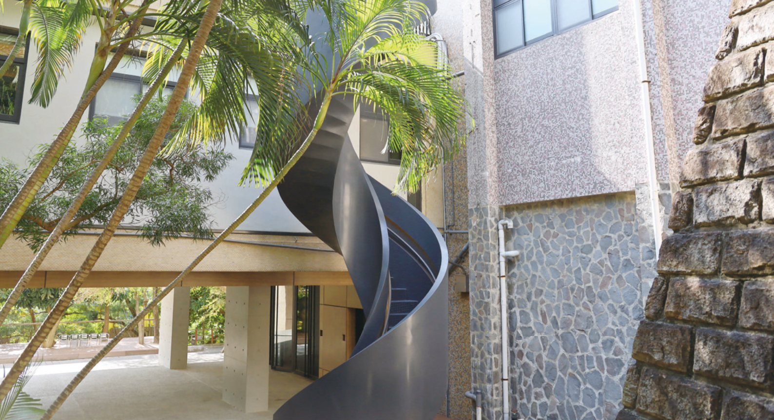
▲ 新近完工的公共藝術作品（A座），與充滿歷史風味的噶哩岸石外牆相互輝映

費，委由許志維建築師設計規畫，陸續完成人社院入口、小展演廳（藝空間）、K書中心、多功能討論室、開放式討論區、外牆、大廳、教室、廁所及連結樓內相關公共空間等三期整修工程。