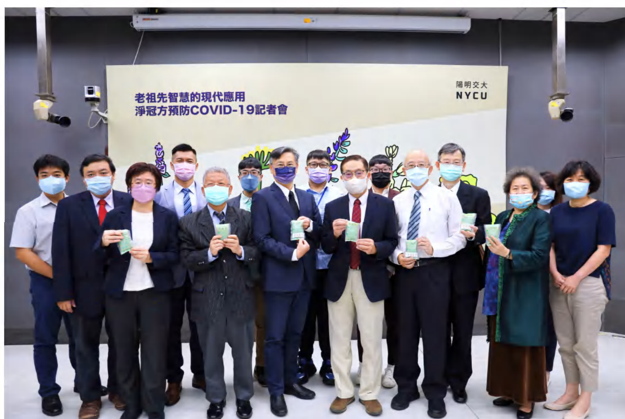
陽明交大4月12日在北門校區舉行記者會，介紹傳醫所開發的「淨冠方」中藥

老祖宗的智慧經過現代醫學證實能預防新冠肺炎。由陽明交大傳統醫藥研究所開發的中藥「淨冠方」被證實可以降低感染，減輕新冠肺炎相關症狀，作為接種疫苗後另一層輔助及減毒防護。後續校方將循AZ疫苗模式公益授權，造福更多民眾。