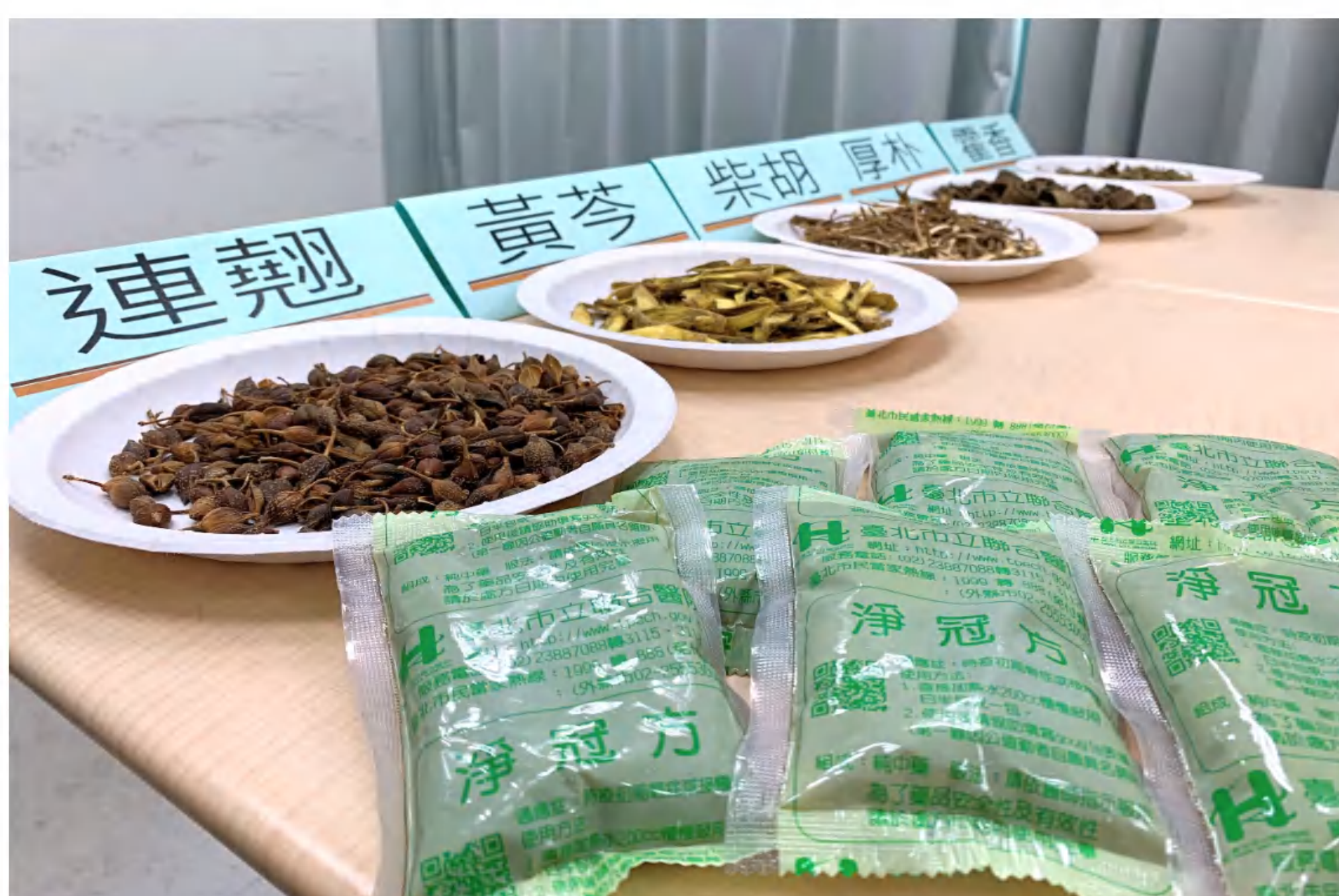
由連翹、黃芩、柴胡、厚朴、藿香五款草藥所組成的「淨冠方」

這帖藥方在台灣尚未大規模接種疫苗的時候，曾提供給超過千名的前線醫護自願服用，一方面作為自保，也作為症狀改善之用。當時有九成受訪者表示服藥一周後，喉嚨痛、咳嗽及頭痛症狀可獲得明顯改善。