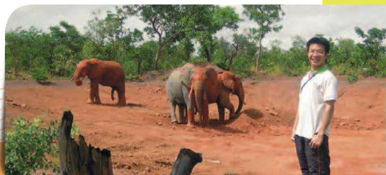
• 大象在泥巴坑玩耍（攝於Nazinga 國家公園）。

黃土路及不整齊的房屋，許多房屋的石牆已經逐漸倒塌，但屋主卻無力修復。路上最常看到的是路人、腳踏車，再來是機車，而四輪車則主要是一天兩班來回首都瓦加古都或前往旅遊重鎮 Bobo 的公車，私家車則非常罕見。這是古都古市的情況。至於其他小鎮呢？除了剛好在柏油路旁的小鎮外，所有的路段都是由泥土路所構成。乾季時，當車子經過這些泥土路時，會有經歷六級地震的感覺；而在雨季，不是無法通行就是需要蜿蜒的蛇行通過。