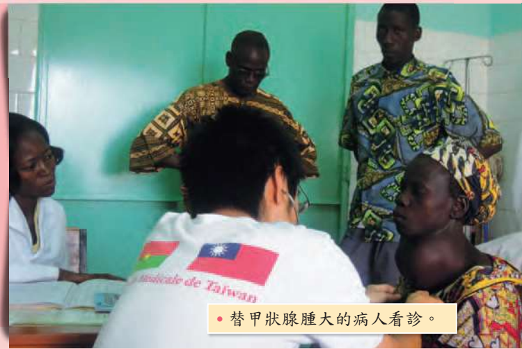
• 替甲狀腺腫大的病人看診。

非洲人生活悠閒，遲到一小時算正常。在比賽時，評審通常一小時後才會陸續到達。在外面吃飯（尤其是餐廳），點完菜之後，一個半小時後上菜也很平常（外食十次大概會遇到九次）！週末，偶爾我會和當地人一起在大樹下「煮茶」及玩遊戲。當地人會用木炭煮茶，煮開之後，將茶倒出再以印度拉茶方式混合數