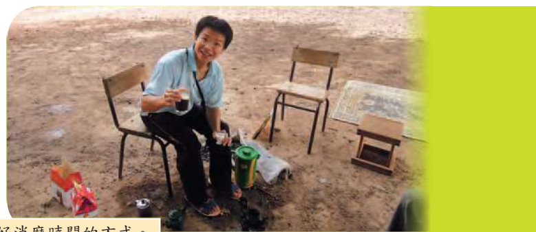
• 煮茶是最好消磨時間的方式。