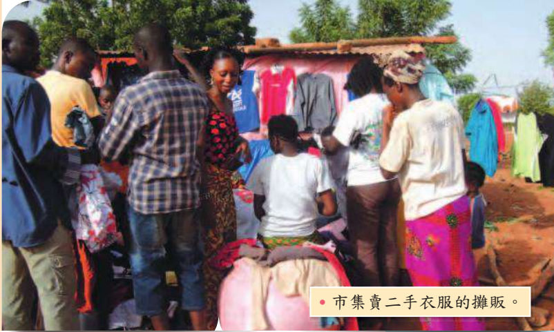
• 市集賣二手衣服的攤販。

節慶或宴客時會把米飯與當地 soubala ( Parkia biglobosa , Néré 種子) 一起炒飯，味道蠻不錯的。此外，當地主要的肉類食物有雞、羊、豬和牛肉。對這些牲畜，白天當地人就將他們外放，在整個城裡自己找食物吃，晚上再帶回家裡關。各自的牲畜也不會搞混或偷牽，實在令人嘖嘖稱奇。而因為布國為內陸國，僅有少量的淡水魚蝦。飲料選擇不多，除了酒精飲料外，就是可口可樂和芬達，偶爾會有當地人自製的洛神花茶、薑汁、當地壯陽茶 (auchatta) 和麵粉水 (zoom koom) 等。