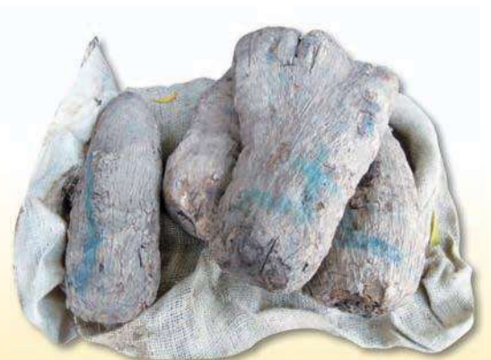
• 當地居民主食 To (透) 的原料。

因為基礎建設不足，交通又不方便，當地人生病時，小病通常等其自行痊癒或以當地民俗的藥物治療。到醫院看病的，通常是住家距離醫院近的病人，或拖到不得不來看病的病人（例如傷口爛到整隻腳見骨之類）。我們所在的友誼醫院（hôpital de amitié），是古都古附近的最大醫院，全院目前只有17位醫師，191床，去年整年看病人次七萬多人。當地並沒有健保或任何其他其他的保險，而醫病關係則取決於醫師的心情、病人是否有工作或貧富差距。所有醫療行為所需的耗材，醫師會給病人或家屬所需購買的單子，待病人先至醫院的藥局購買之後，才開始進行醫療行為。當然，所謂的醫療行為包括生產或臨時大出血。