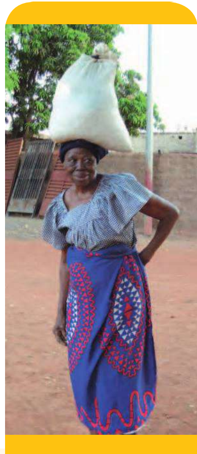
• 居民習慣以頭頂物。

來到布吉納法索除了醫療外，我也認識了他們的飲食、節慶、貧富差距及生活方式。我也常在部落格上與朋友分享我的心得。我將在今年九月底服役完畢，在這裡的時間雖然短暫，但是布國服役的經歷，卻是我生命中精彩又特殊的經驗。——