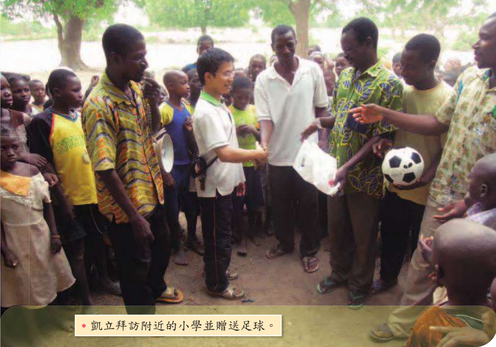
• 凱立拜訪附近的小學並贈送足球。