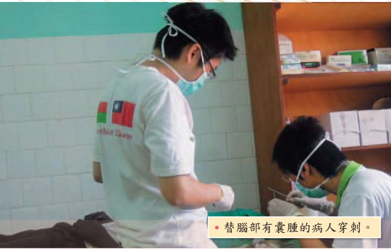
• 替腦部有囊腫的病人穿刺。