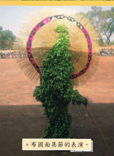
• 布國面具節的表演。