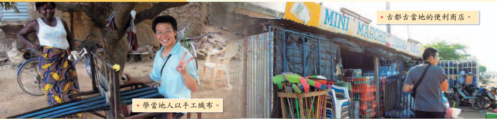
• 學當地人以手工織布。