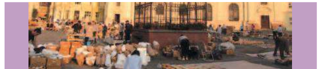
• 羅馬尼亞議會大廈是世界第二大的政府大廈

一個流著血又流著蜜之地～巴爾幹半島，這裡的地理位置、戰略地位、種族情懷、宗教信仰、生活習俗、文化差異等問題，歷經了幾個帝國的洗鍊壓迫下，卻能各自發展出自己獨特的人文風情與文化，的確是人一生之中值得到訪的地方。 ————