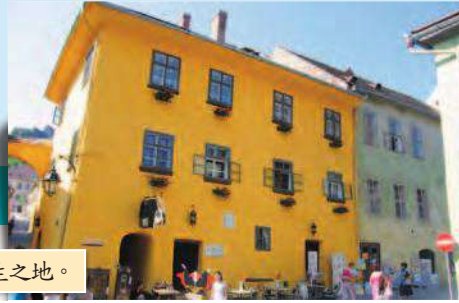
• 黃色老屋是吸血鬼德古拉伯爵出生之地。