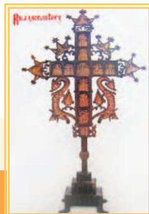
• 里拉修道院的博物館，藏有華美的十字架，是用小針式雕刻在十字架上，內敘述133篇聖經故事，共花了十二年完成