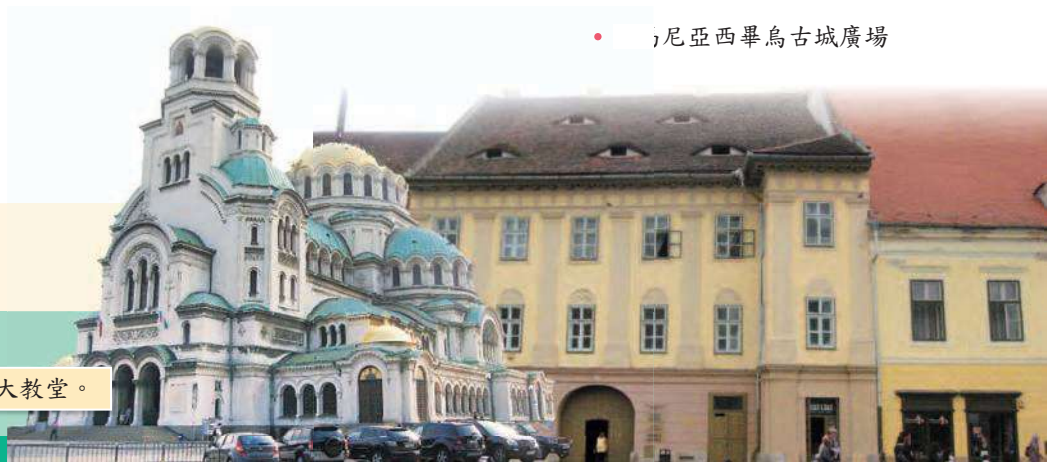
• 保加利亞 亞歷山大涅夫斯基東正教大教堂。