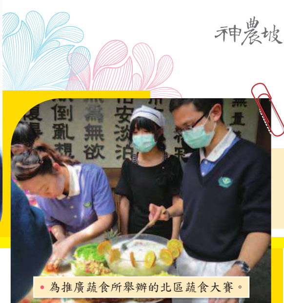
• 為推廣蔬食所舉辦的北區蔬食大賽。