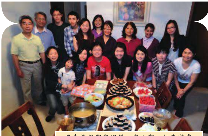
• 慈青準備家聚好料，邀大家一起來嘗嘗。

慈青以營隊為道場，目前一年約有十二個營隊可以參加，學習如何待人接物，練習在團隊中樂於承擔、勇於配合，讓年輕的生命充滿自信的風采，因為有愛所以無畏，因為付出所以成長。