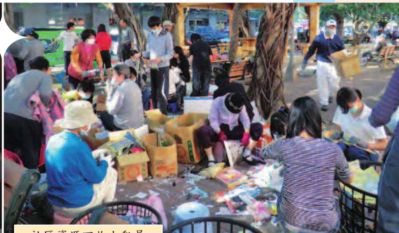
• 社區資源回收大動員。