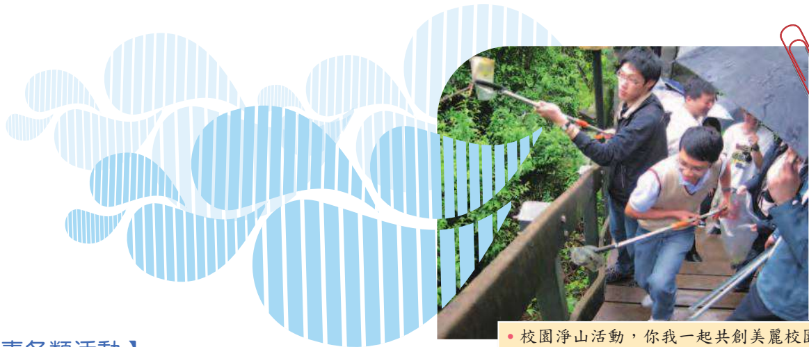
• 校園淨山活動，你我一起共創美麗校園。