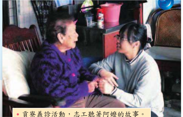
• 貢寮義診活動，志工聽著阿嬤的故事。

或許很多人會遲疑是否在慈青社就必須吃齋唸佛，其實慈青社是一個提供各式志工機會的平台，沒有任何宗教信仰的限制，你不會被強迫做什麼事。在這裡，我們只需挽起袖子，一同為這個社會和地球盡一份心力。學習如何謙卑處事、和樂待人；懂得知福惜福、精益求精。很多事光說沒有用，在行動的當下自然會有一番豐獲；從簡單的做起，相信你會覺得~~原來行善這麼簡單！！(*^·^*)