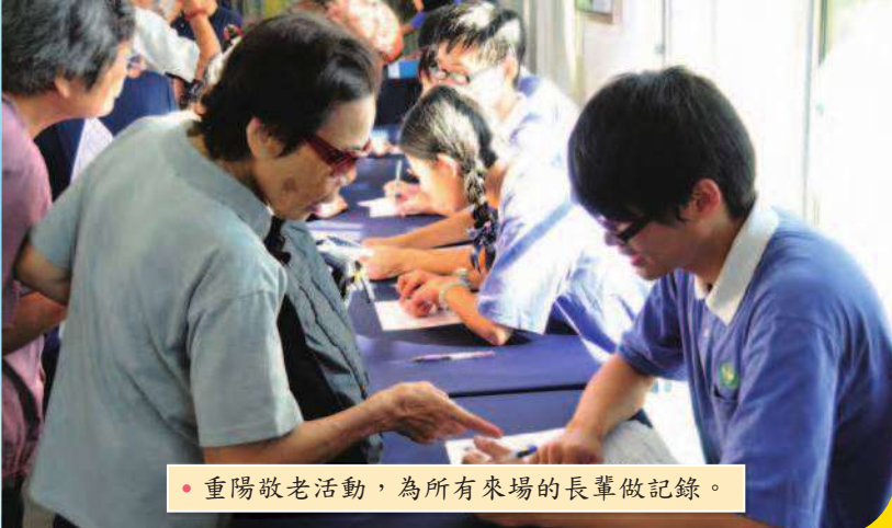
• 重陽敬老活動，為所有來場的長輩做記錄。