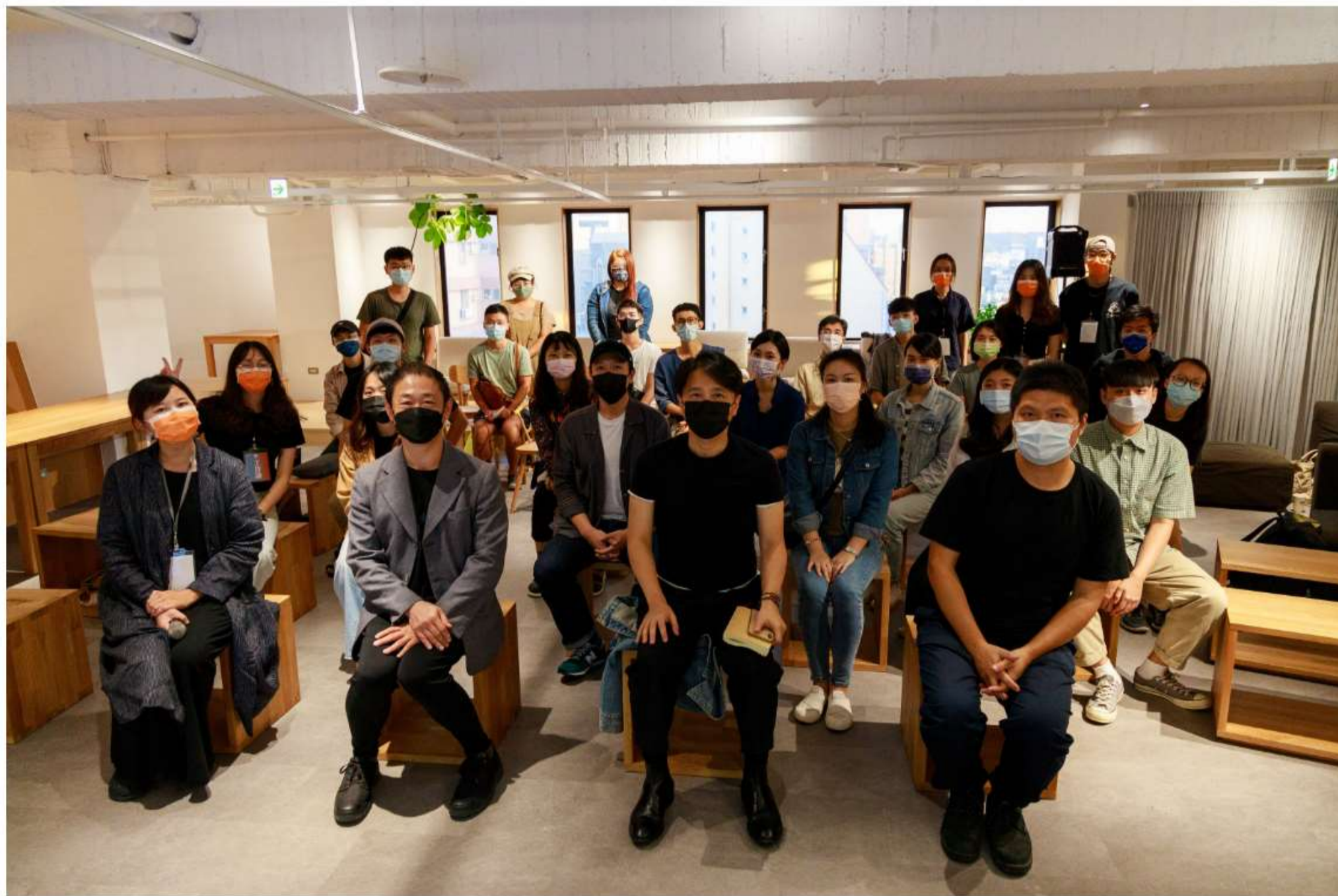
Open House Hsinchu團隊

首年參與「Open House Hsinchu打開新竹」的開放點接近70個，空間類別多元。而陽明交大許多不對外開放的空間也加入本次打開行列，包括具前瞻性與創新研發設備的ICT創創工坊、國內大學首創虛擬角色「妮酷」的虛擬攝影棚、謝英俊建築師設計的客家學院圖樓建築和鄰近的三合院歷史建築忠孝堂、小問禮堂，都是本次活動開放參觀熱點。