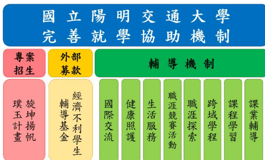
▲ 圖 1 - 陽明交通大學完善就學協助機制

本校為了促進經濟或文化不利學生安心就學，111 年度以「提升經濟或文化不利學生入學機會」及「經濟不利學生輔導機制及建立外部募款基金」二大分項進行。學務處及教務處針對經濟或文化不利學生設立輔導機制，包含：課業輔導、課程學習、跨域學程、職涯探索、職涯競賽活動、生活服務、健康照護、國際交流等八個項目（圖 1）。