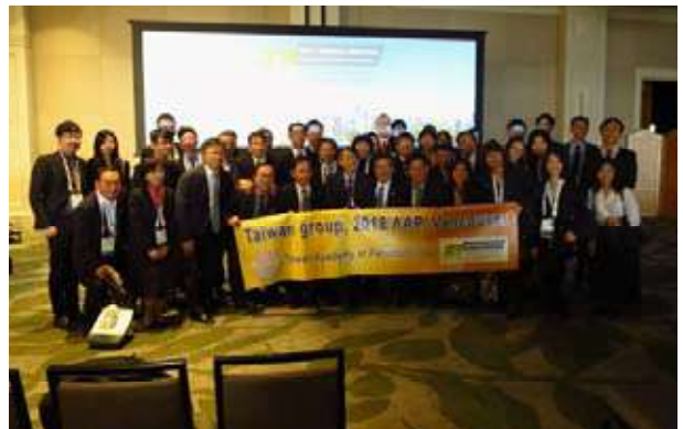
(圖三) 泛太平洋牙周論壇會後大合照