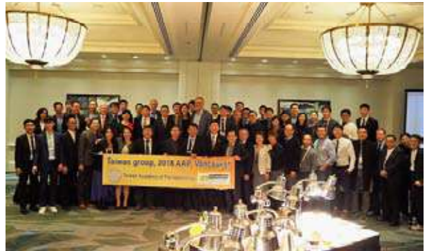
(圖一) 今年十月本會組團參加在溫哥華舉辦的美國牙周病醫學會年會，台灣有五十多位團員參與