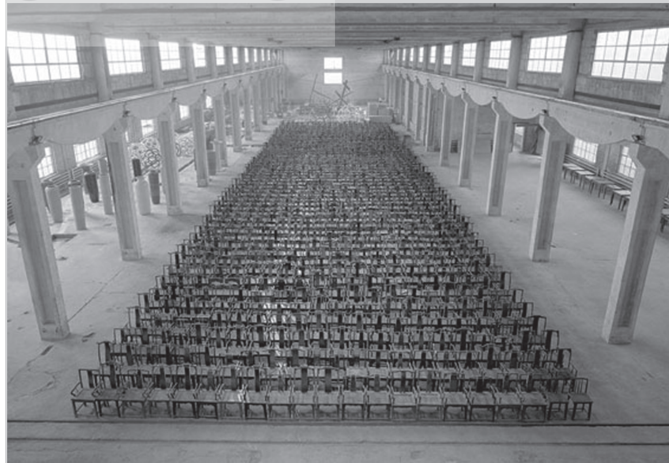
《童話》(Fairytale), 2007 1001把清朝(1644-1911)木椅 展於德國第12屆卡賽爾文件大展