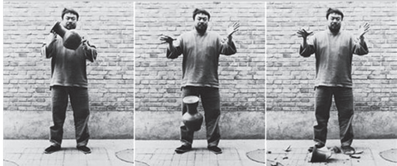
《失手》 ( Dropping a Han Dynasty Urn ), 1995 黑白攝影三連作 148×121公分 艾未未工作室提供