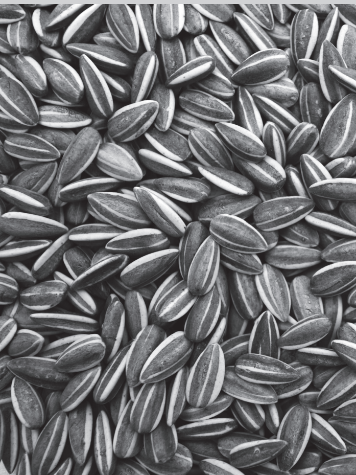
《葵花籽》( Sunflower Seeds ), 2010 陶瓷與釉料, 一億顆