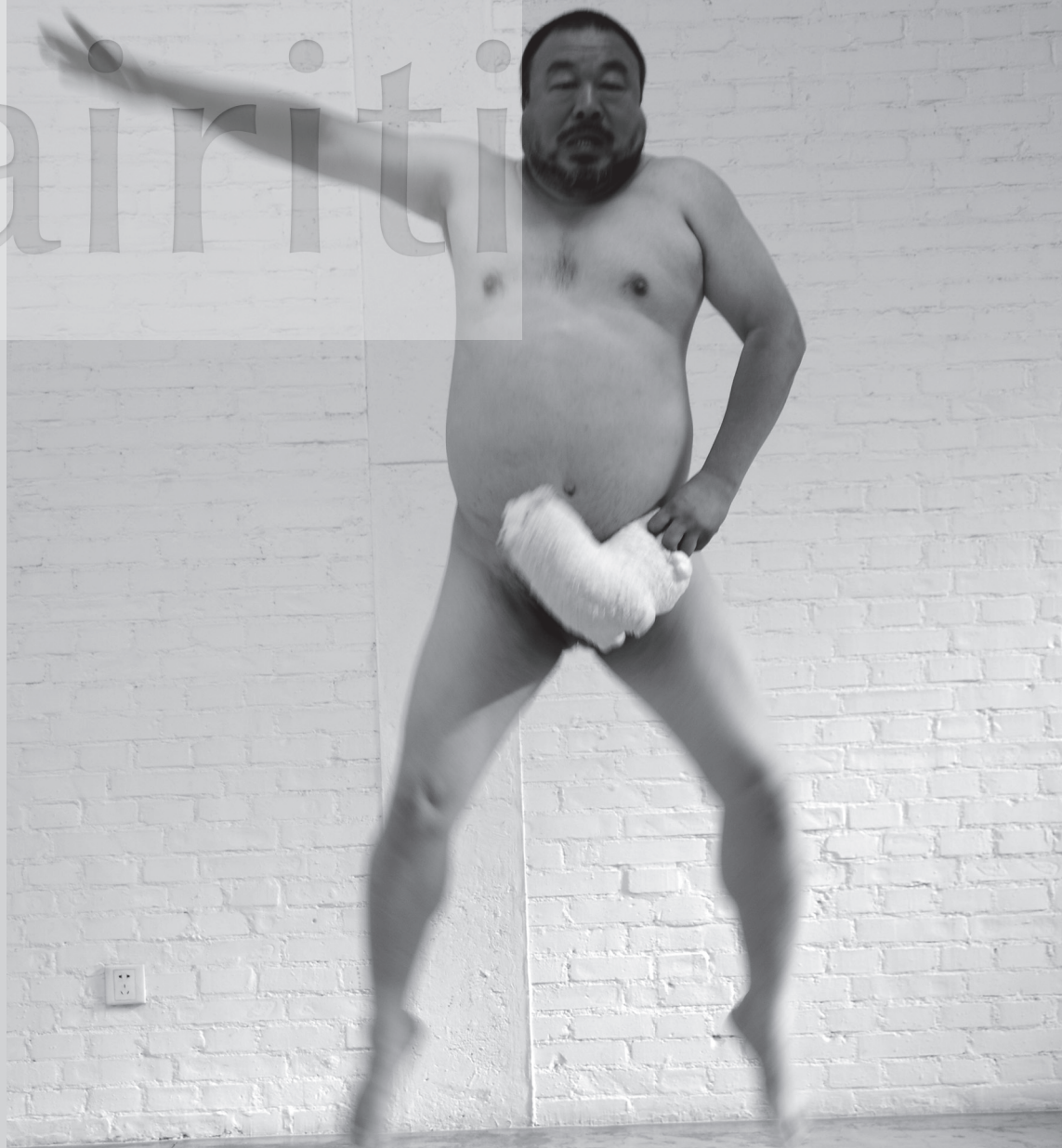
《騰飛不忘擋中央》