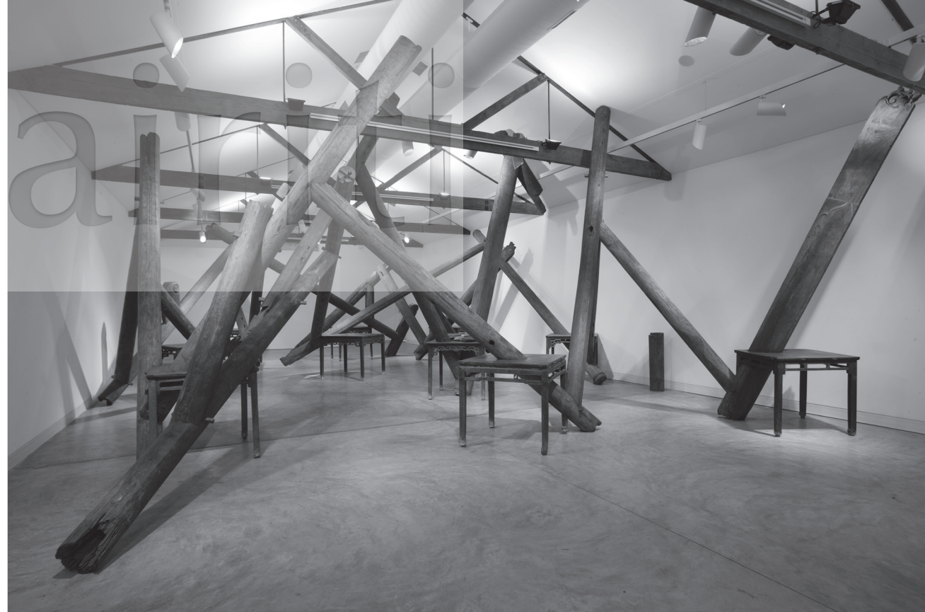
Through, 2007-2008 清朝(1644-1911)寺廟的鐵力木桌椅、樑柱，850×1380×550 cm