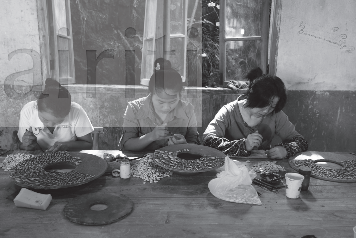
《葵花籽女工製作圖》 ( Sunflower Seeds by workers ), 2010 陶瓷與釉料, 1600位女工製作一億顆