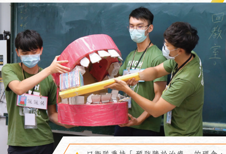
▲ 口衛隊秉持「預防勝於治療」的理念，教導學童正確的衛教觀念與刷牙方式

是什麼精神維繫著陽明交大口衛隊，40多年來細水長流、屹立不搖？答案早已鐫刻在每個陽明交大牙醫人的心中。