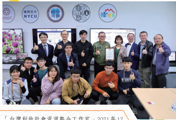
▲ 「台灣利他社會資源整合工作室」2021年12月捐贈新台幣80萬元，協助陽明交大口衛隊進行偏鄉地區學童口腔醫療相關服務