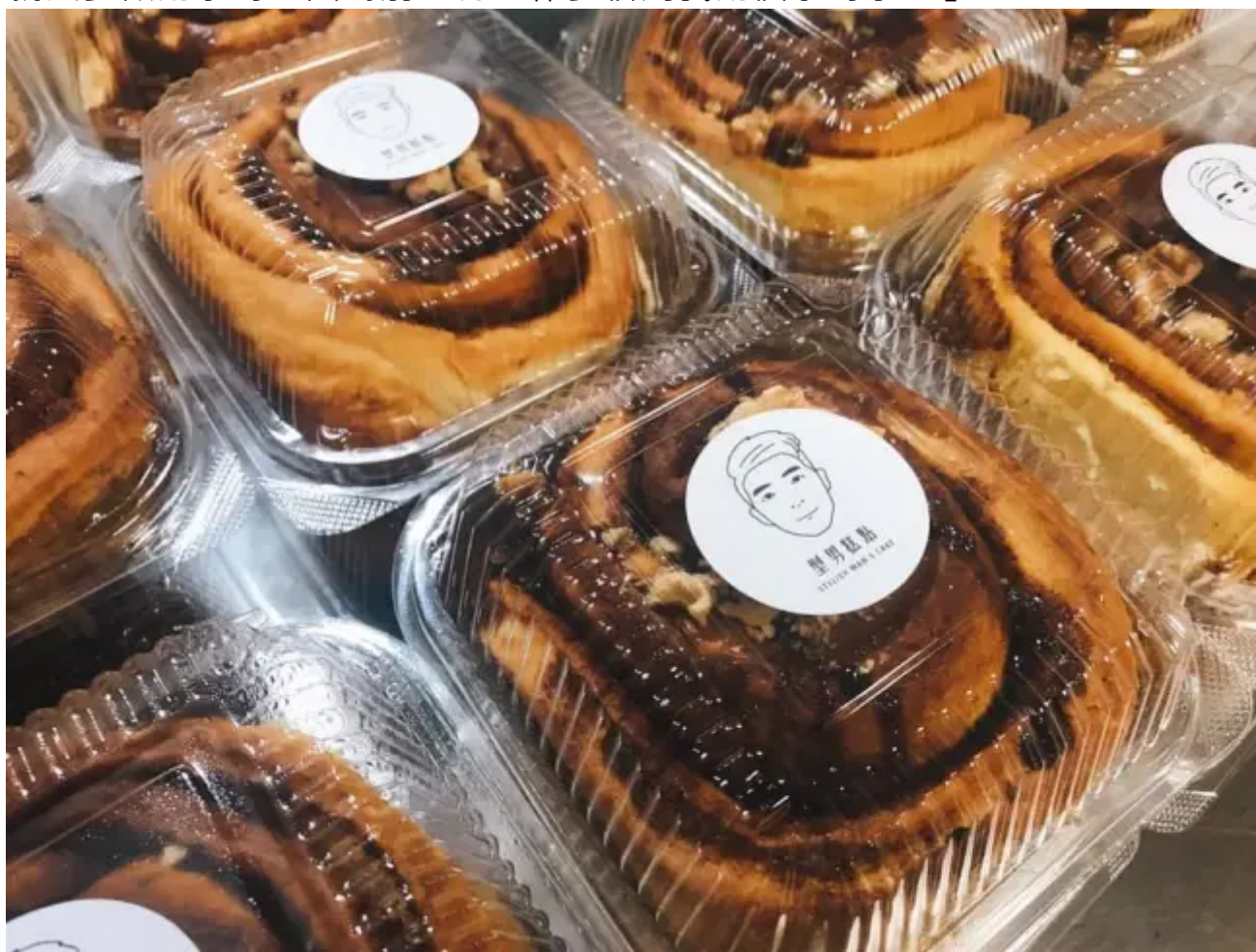
▲ 家誠的甜點品牌，圖為手做肉桂捲。

而家誠現在一邊擔任科技業業務，一邊利用下班時間經營型男糕點，同時是受薪階級與給薪階級的他在兩個社會角色中不斷尋找平衡，家誠告訴我們，現在社會已經不像從前，努力不一定能有回報，努力似乎只佔成功的百分之二十，但是轉念一想，如果連能自己掌控的20%都不努力了，怎能期望通過80%獲取成功呢？因此家誠以健康為代價，有時發起狠來，加班到10點後繼續到工作室與糕點鏖戰，以沙發為床、一天睡4個小時早已是家常便飯，受訪時家誠是這麼講的：「有時候加班加兩個小時，那我糕點就去多做兩小時，因為前一份工作多佔用我兩個小時了！」