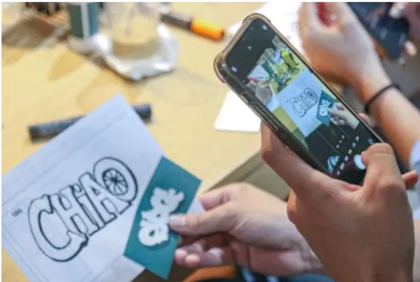
▲ Allo所創辦的SPG-街畫人工作室內環境

▲ 跨入藝術領域需要具備哪些特質？Allo一次告訴你！ ( 影片來源 / 王幃帆製 )