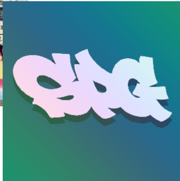
Allo所創辦的SPG-街畫人工作室部分塗鴉作品 ( 圖片來源 / Facebook ) ▲