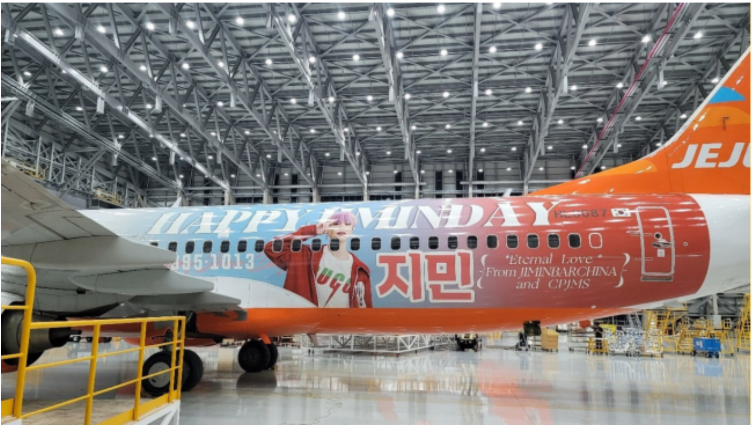
▲ 中國粉絲打造為朴智旻彩繪飛機應援。