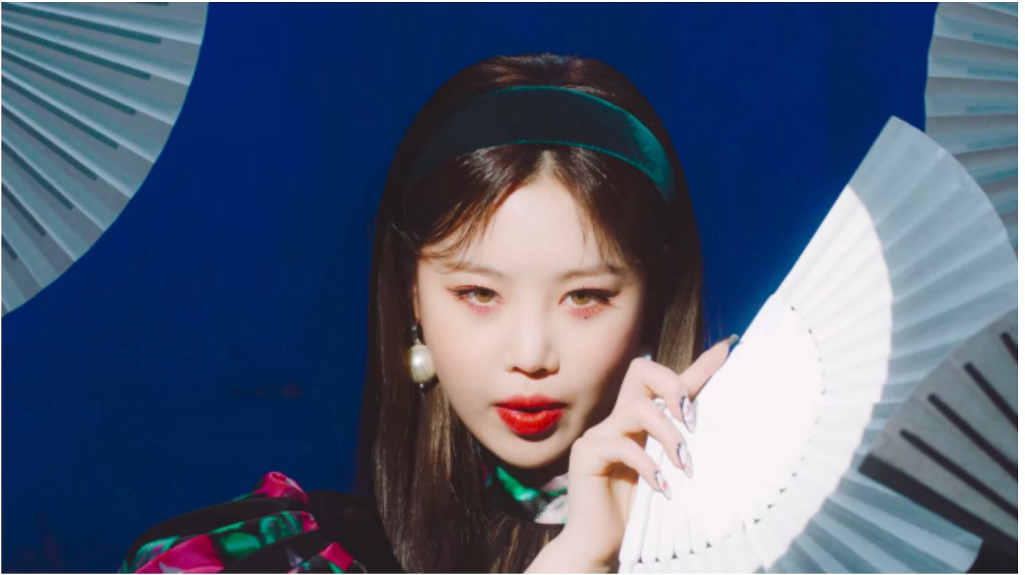
▲ (G)I-DLE成員穗珍。