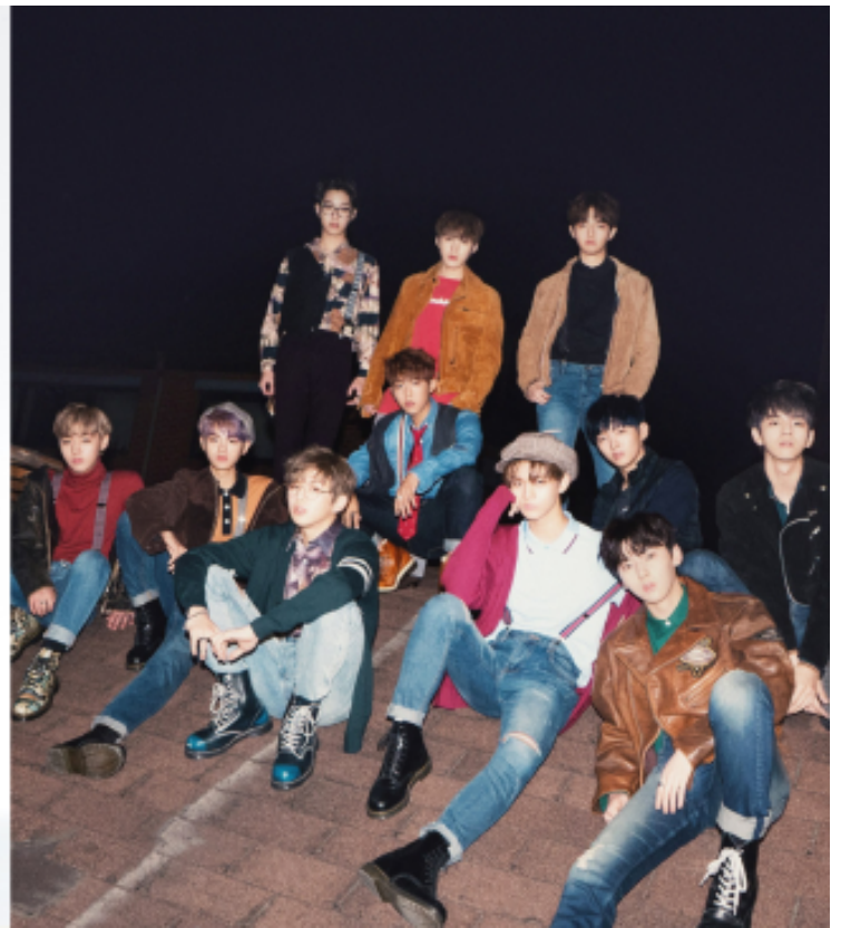
▲ 限定偶像團體IZ*ONE (左) 與WANNA ONE (右)。

相對韓國演藝市場，粉絲權力擴大在社會不全然為負面的趨勢。寶賤認為， 粉絲權力擴大其實有助於K-pop本身的擴張 。如同現在選秀節目並非只有韓國大眾才能參與，台灣、中國、日本等地粉絲，有了媒體管道皆能參與其中。「粉絲影響力變大之後，粉絲可以自己決定很多事情，可能專輯買越來越多，韓國偶像可以拿到更多的錢，粉絲也可以花得更開心，我覺得這算是相輔相成啦。」在寶賤眼中， 粉絲權力擴大的趨勢各有利弊 ，但未來的發展我們就不得而知。