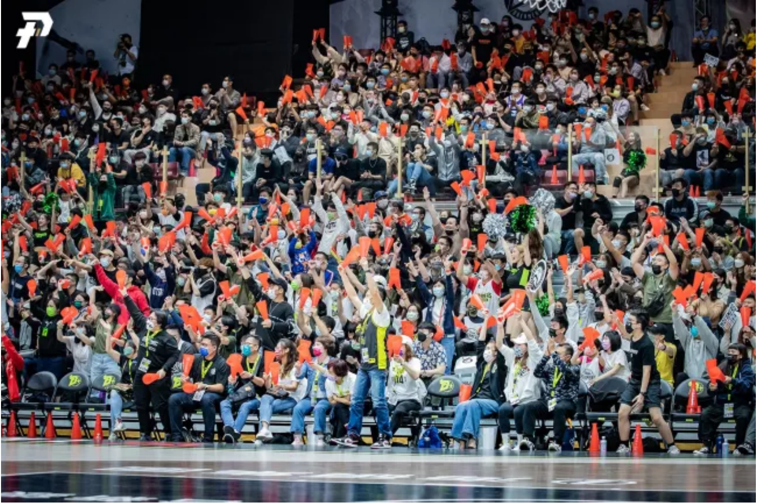
▲ P.LEAGUE+賽事現場座無虛席，球迷熱情支持喜愛的球隊。

「所以P.LEAGUE+（臺灣男子職業籃球聯盟）能夠在2020年成立後掀起風潮，是因為我們對籃球有基礎認識，只要推波助瀾，就能喚起大家年少時對籃球的記憶。」吳奕賢說：「今天假設是足球，就算搭配大牌球星大肆宣傳，我也不認為觀眾買票入場比例會那麼高，因為我們不夠熟悉。」