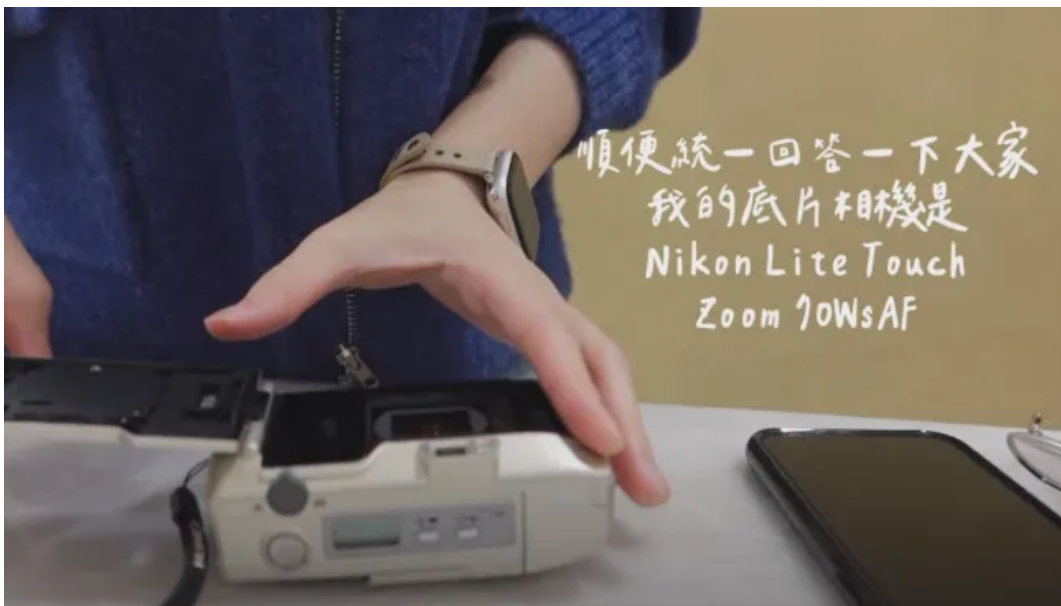
▲ Sabrina經常在影片裡向觀眾分享生活中的一切，就像朋友聊天一樣，影像提供了比語言更接近真實的陪伴。