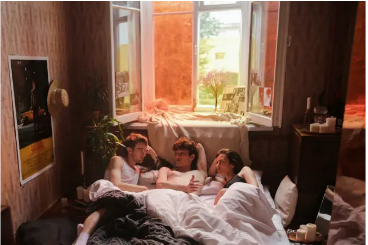
▲ 社會的道德界線框架著我們對於性的看法。