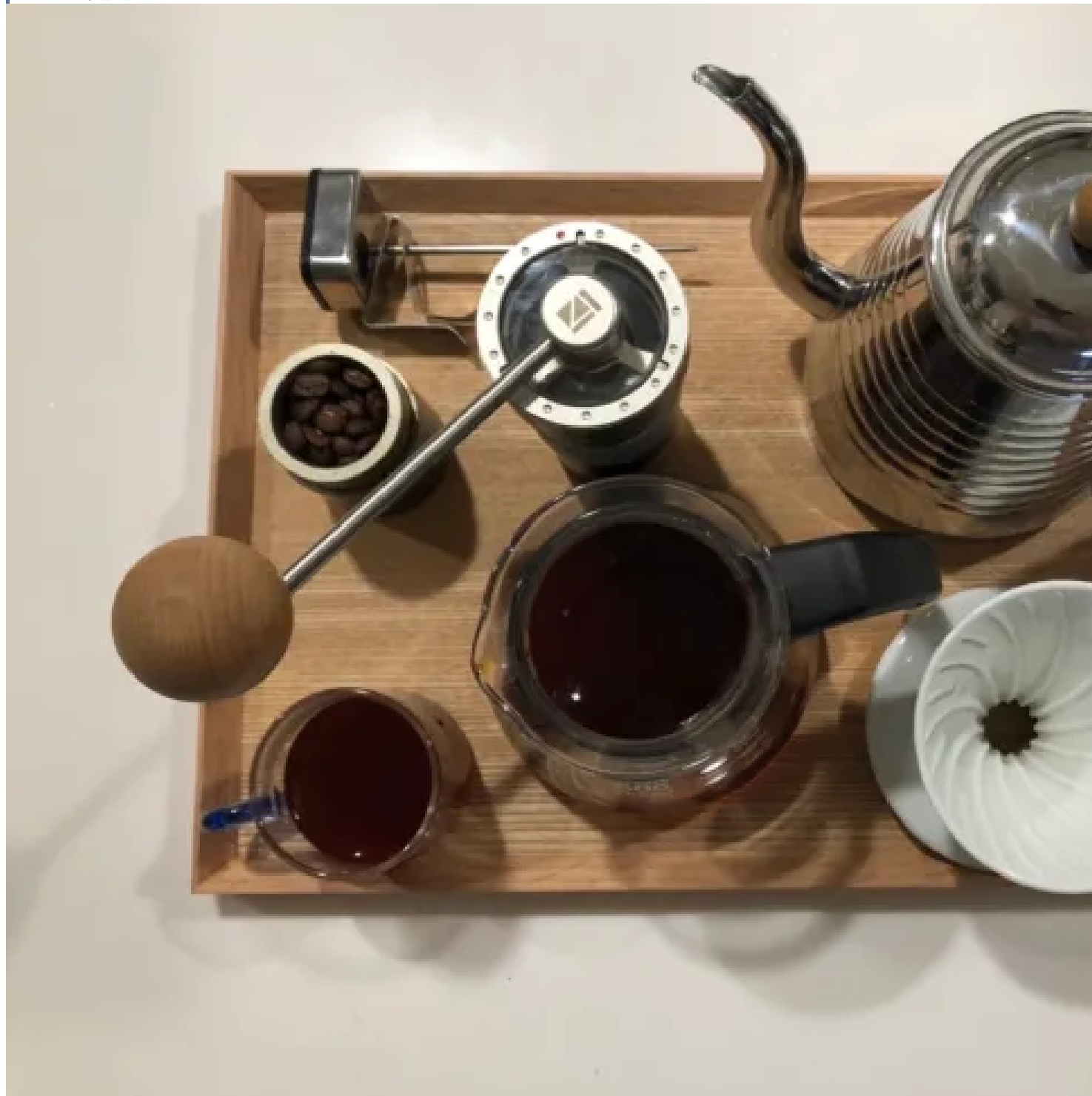
▲ 黑木咖啡的咖啡豆及簡易的沖煮器具。

2020年，COVID-19迅速的擴散至全球多個國家，造成一場影響全球的大瘟疫，大家的生活也在疫情之下有了改變、許多計畫延宕，可能對於未來不確定性增加。在這樣的情形下，原先在新竹科學園區擁有穩定工程師工作的蔡仲堯，仍然決定轉換跑道，創立屬於自己的咖啡品牌——黑木咖啡。