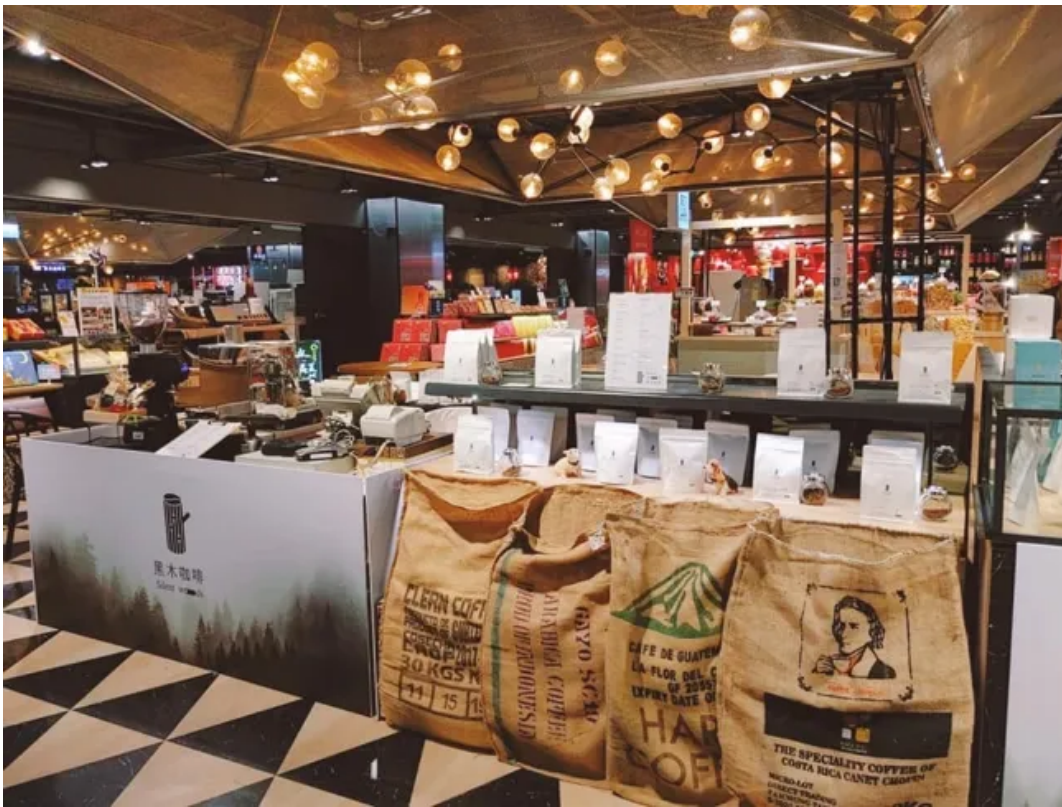
▲ 今年四月於高雄高鐵站新光三越設立臨時櫃。