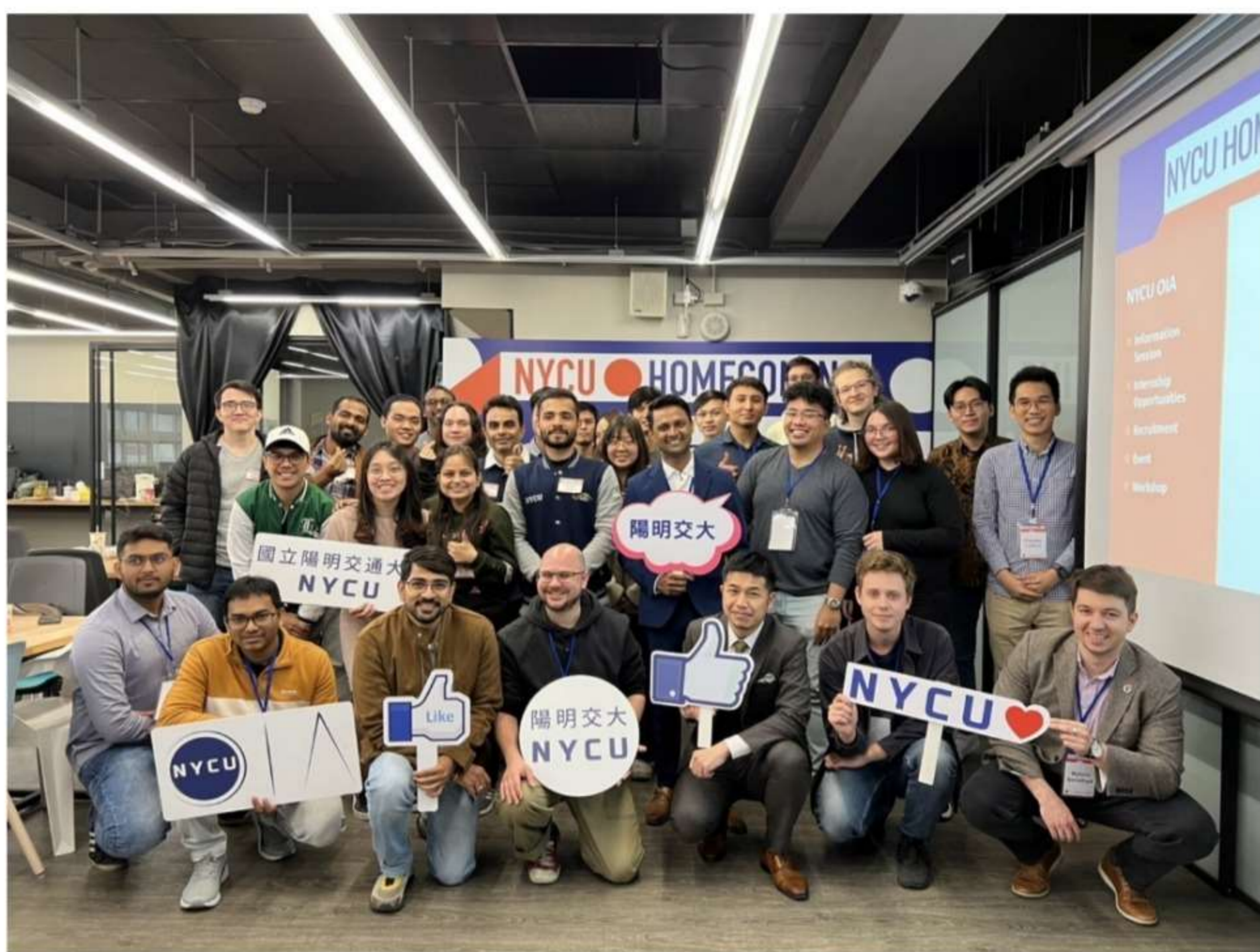
國際處邀請了11位現正分別於台灣科技及醫療產業工作的境外生校友，與在學外籍生分享在台的學習過程和在台就業經驗

此外，國際處也特別舉辦境外生校友回娘家活動，邀請了11位現正分別於台灣科技及醫療產業工作的外籍校友，與在學外籍生分享在台的工作及生活經驗並促進交流，首次舉辦即大獲外籍學生好評。