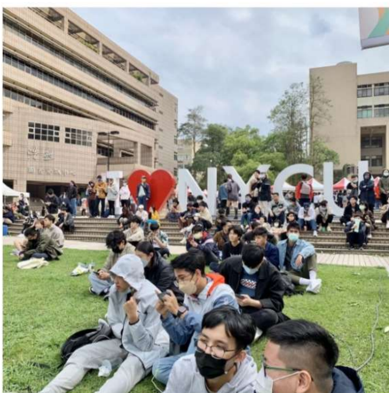
隨意在草地坐下享受chill的午後，也開啟對大學生活的想像

熱鬧滾滾的校系博覽會在4月8日登場，陽明交大30個大學部招生單位，整天不間斷舉行招生博覽會、座談會等活動，廣邀全台高中生參與，讓學子對本校各學系有更深入的了解。活動吸引近千名高中生入校參觀了解系所課程及未來職涯規劃，他們也現場見證了傳統交大日所舉辦的系友回娘家活動，與已經於母校畢業，並在社會上有成就及貢獻的大學長、學姊們互動。此外，由學聯會所主辦的草地音樂會，也吸引了大批高中生及家長的目光，提前體驗陽明交大大學生的日常，隨意在草地坐下享受chill的午後，也開啟對大學生活的想像。