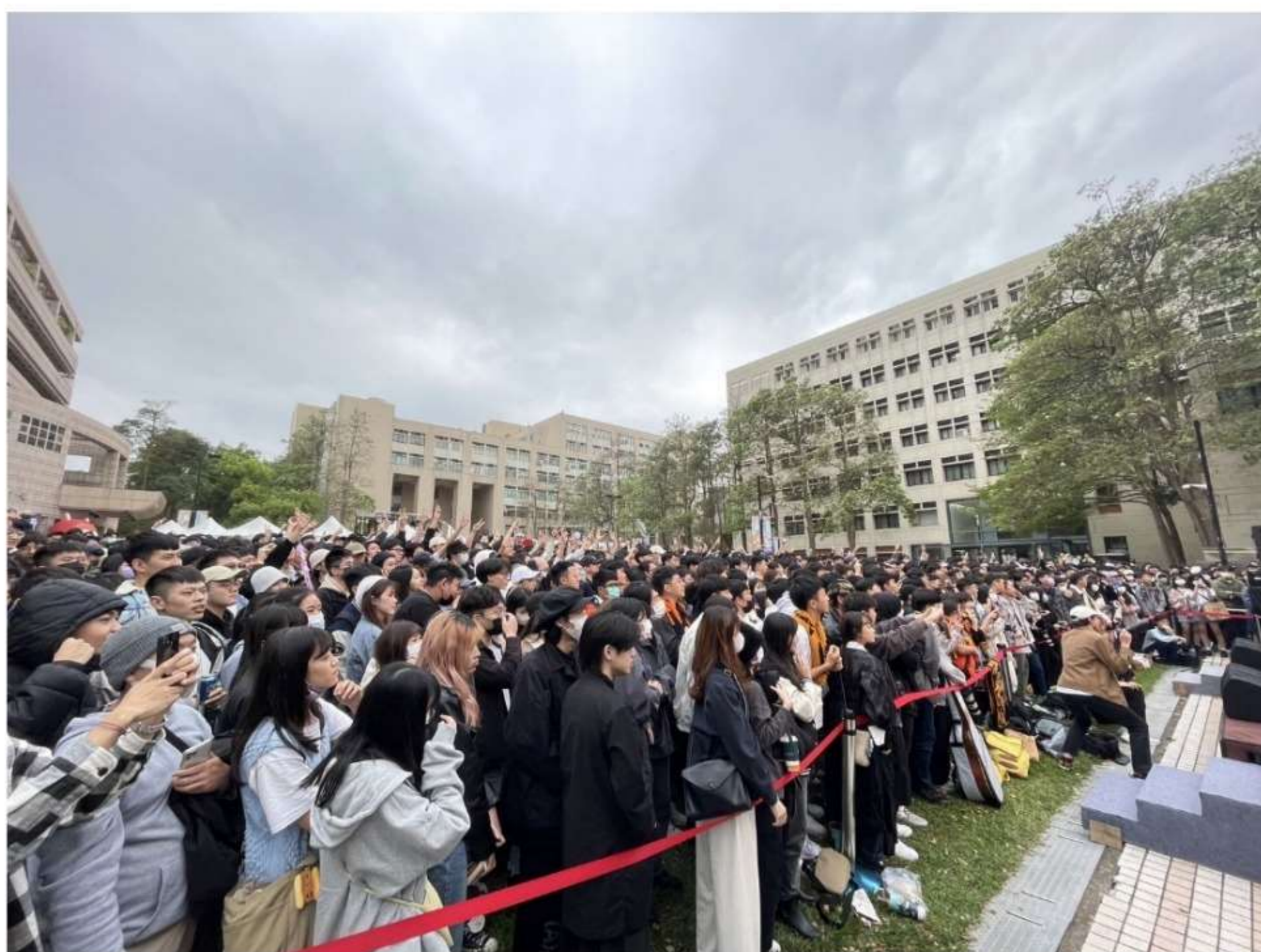
校系博覽會在4月8日熱鬧登場，吸引近千名高中生

熱鬧滾滾的校系博覽會在4月8日登場，陽明交大30個大學部招生單位，整天不間斷舉行招生博覽會、座談會等活動，廣邀全台高中生參與，讓學子對本校各學系有更深入的了解。活動吸引近千名高中生入校參觀了解系所課程及未來職涯規劃，他們也現場見證了傳統交大日所舉辦的系友回娘家活動，與已經於母校畢業，並在社會上有成就及貢獻的大學長、學姊們互動。此外，由學聯會所主辦的草地音樂會，也吸引了大批高中生及家長的目光，提前體驗陽明交大大學生的日常，隨意在草地坐下享受chill的午後，也開啟對大學生活的想像。