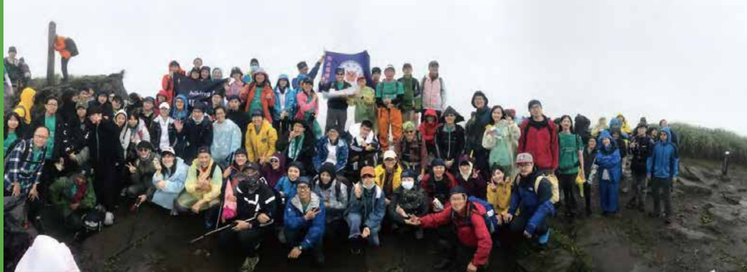
綠教室～陽明山無痕縱走 | 會師於陽明山最高峰 - 七星山主峰