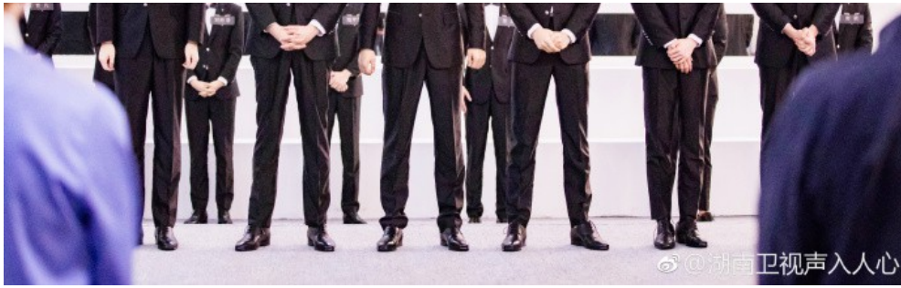
成員們被粉絲暱稱為「梅溪湖男團」。