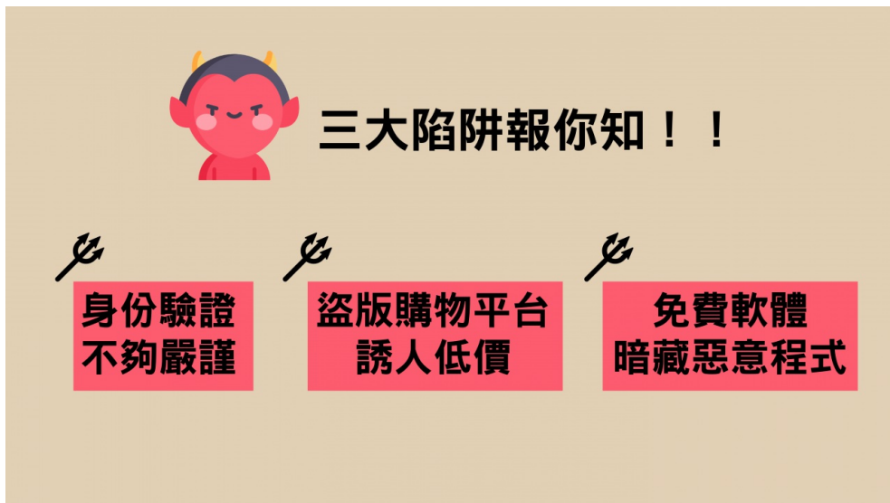
行動支付三大常見陷阱 ( 圖片來源 / 李芝謙製 )

國立交通大學資工系黃俊穎教授表示，要避免三大陷阱，培養好的「習慣」是最重要的。許多人在下載軟體時，並不會去注意到軟體的來源。為了省錢下載破解版軟體，或是不顧後果的授權都是非常危險的行為。以合法管道取得軟體，以及在軟體要求不合理的授權時，將其解除安裝，就能有效避免惡意程式的攻擊。