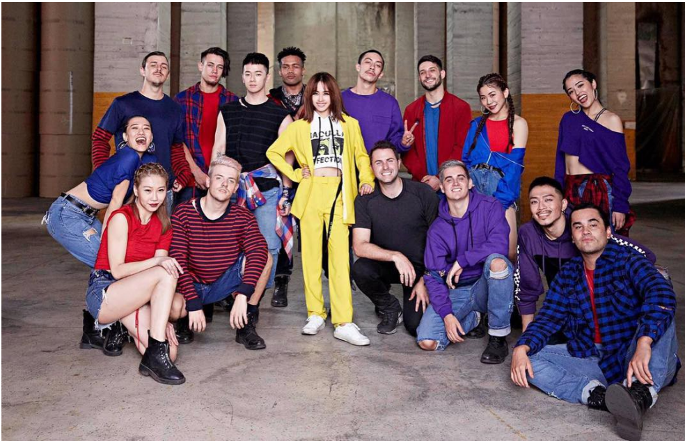
與蔡依林合作《玫瑰少年》時的合照，蔡依林位於照片中間，翁蕊位於右上。

至於和天后蔡依林的合作經驗，翁蕊表示很感謝擁有機會加入團隊，但是因為這和自己平常在做的工作類似，所以沒有什麼太大的不同，並不會因為藝人「大不大咖」而有所改變，但是依然點頭稱：「蔡依林確實是很專業！」