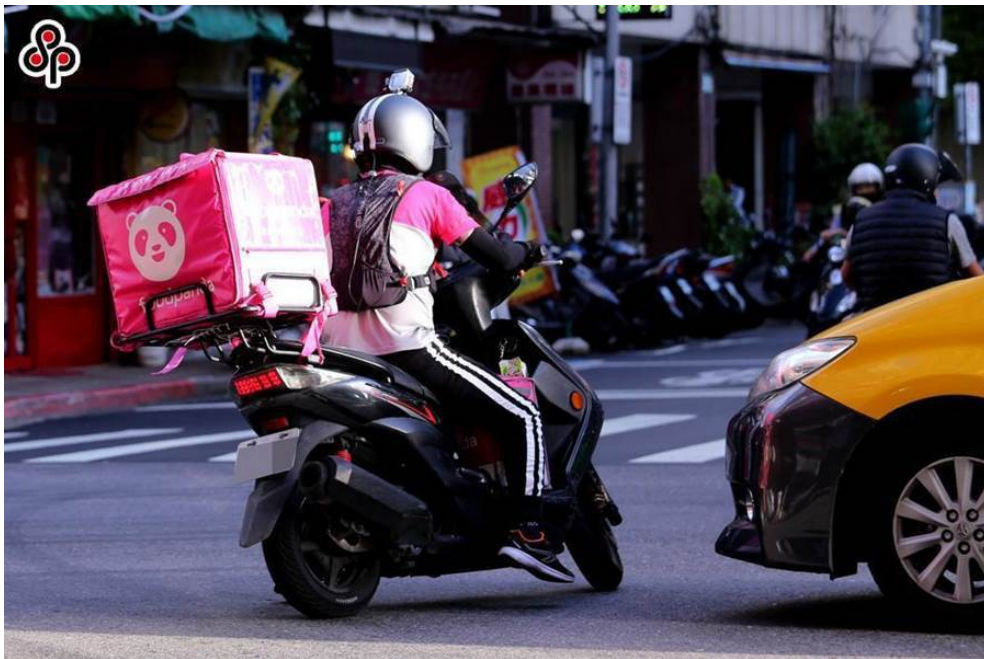
外送平台在近期很容易在馬路上看到

近年來因外食族不斷增長，根據經濟部統計，今年餐飲業營業額高達722億新台幣，相較於去年成長了5.71%，而業者也抓住「宅風潮」，透過結合外送平台讓消費者在家中動動手指就能享用美味的食物，近期各大外送平台更爭先恐後與鼎泰豐、星巴克等知名連鎖企業合作，希望能拓展更多用戶族群及知名度。於台灣最大外送平台：2016年在台推出的UberEats及2012年的FoodPanda（以下簡稱「熊貓」），兩者合作店家皆超過3000家以上，UberEats號稱過去一年內在用戶和跑單次數成各成長了一成，「熊貓」則表示從成立至今近7年的時間，活躍使用者增加20倍，一週訂單更是超越近七年總和，而因「熊貓」使用者的快速翻倍成長，就曾出現過於台北第一女子高級中學校門口出先「粉一遍熊貓海」的驚人現象。外送訂單量的激增，相對地會造成機車流量的大幅成長，除了造成交通壅塞問題，更有增加交通事故的疑慮。